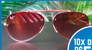
RAY BAN ROSA