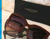
CLIPON SABRINA SATO 3 EM 1