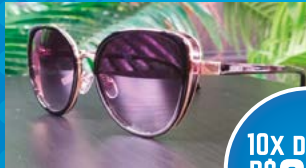
PETRUZ MASCULINO E FEMININO