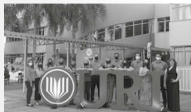
Direção e professores da Escola da URI

Diante do cenário atual, as formaturas ocorreram no formato Drive-Thru respeitando todos os protocolos de distanciamento, e transmitidas através do YouTube no canal da escola. Os for-