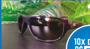
RAY BAN PRETO