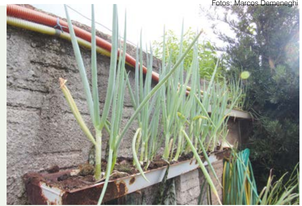
Cebola plantada em uma calha de lâmpada fluorescente