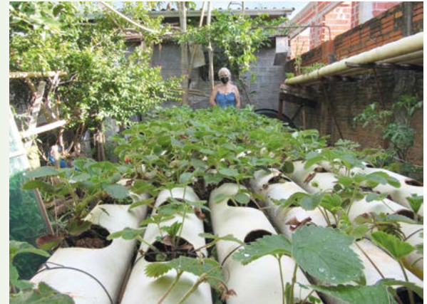
Morangos em canos de PVC