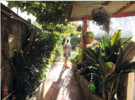
Corredor onde crescem as videiras e plantas ornamentais