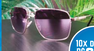
PETRUZ MASCULINO E FEMININO