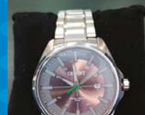
RELOGIO ORIENT MASCULINO