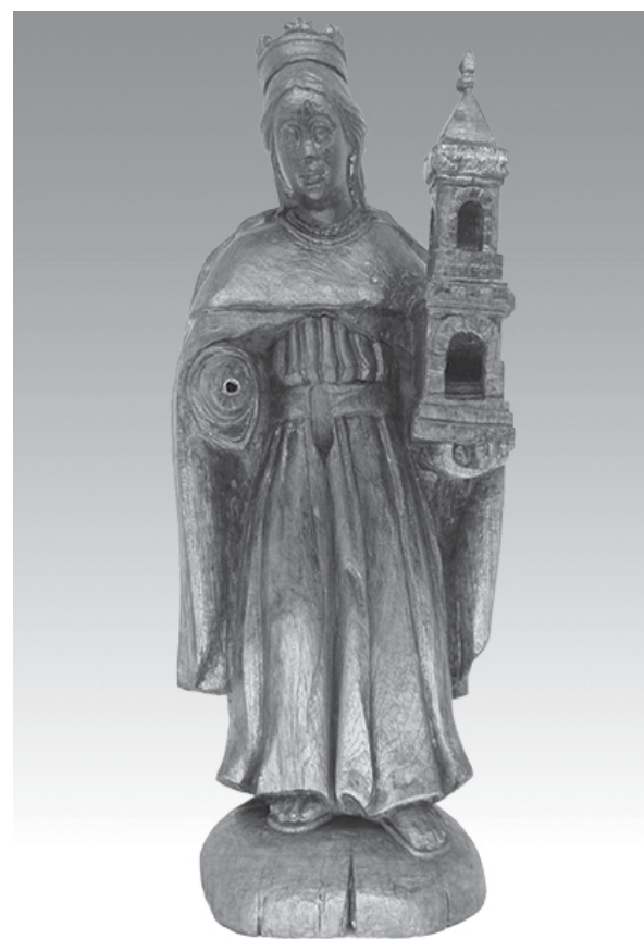
Escultura Missioneira de Santa Bárbara