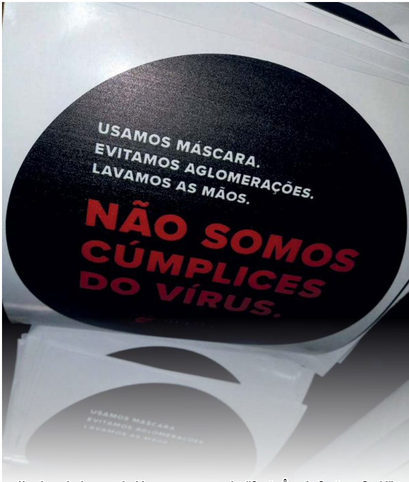
Um dos adesivos produzidos para a campanha "Santo Ângelo Contra a Covid"

Covid-19 mata uma pessoa a cada quatro dias em Santo Ângelo