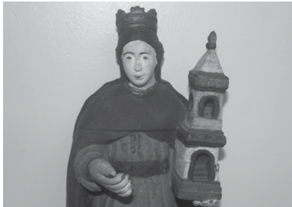
Antes do restauro estético