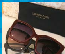
CLIPON SABRINA SATO 3 EM 1