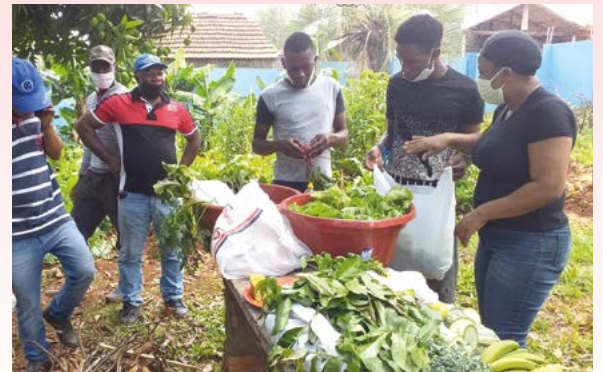
As manhãs de sábado são usadas para colheita e manutenção dos canteiros