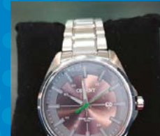
RELOGIO ORIENT MASCULINO