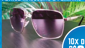
PETRUZ MASCULINO E FEMININO