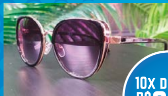
PETRUZ MASCULINO E FEMININO