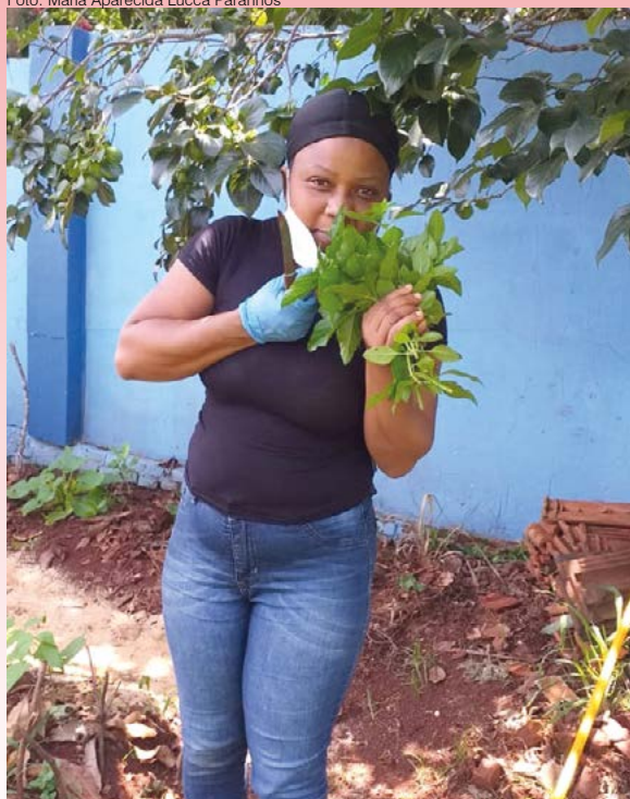
A horta também produz ervas aromáticas como manjeriço, hortelã, menta, entre outras

apreciadas pelos haitianos), além de plantas medicinais e ervas aromáticas muito apreciadas para chás e para o preparo de suas refeições. Por enquanto, a irrigação é feita com água da rede de distribuição da cidade, mas a ideia é captar a água do telhado da escola, armazená-la e usá-la para garantir o desenvolvimento das plantas, exclusivamente com a água da chuva.