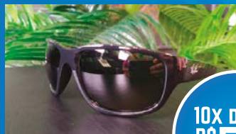
RAY BAN PRETO