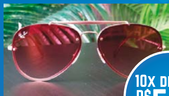
RAY BAN ROSA