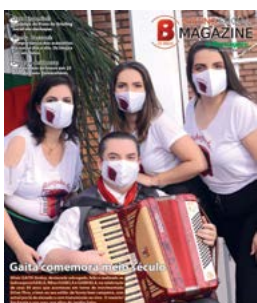
Gaita comemora 25 anos