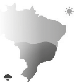
El Niño De uma forma geral, chove muito na região Sul e há seca no Nordeste