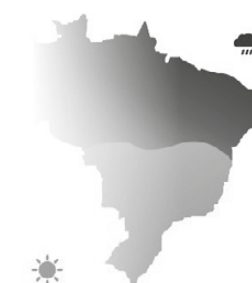
La Niña O clima fica mais seco e frio no Sul. No Nordeste, chove mais