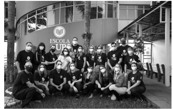
Professores da Escola da URI

A Escola da URI Santo Ângelo recebe, de 9 a 17 de novembro, inscrições para bolsas de estudo.