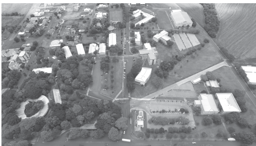
Vista aérea do campus de Santo Ângelo da URI

Os candidatos com as inscrições homologadas ficam convocados para o comparecimento no local de realização das Provas, em dia e horário estabelecidos. Os exames serão aplicados dia 20 de novembro de 2020, na URI Santo Ângelo, sala 20202, prédio 20, sendo a Prova de Língua Inglesa às 8h 30