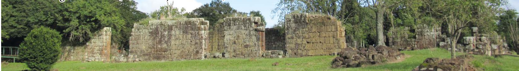
Sítio Arqueológico de São João Batista, interior de Entre-Ijuís

Coordenada pelo Iphan as ações tem o propósito de interromper processos de degradação do patrimônio, o projeto prevê intervenções parciais de conservação nos remanescentes arqueológicos dos sítios de São Miguel das Missões, São Lourenço Mártir e São João Batista