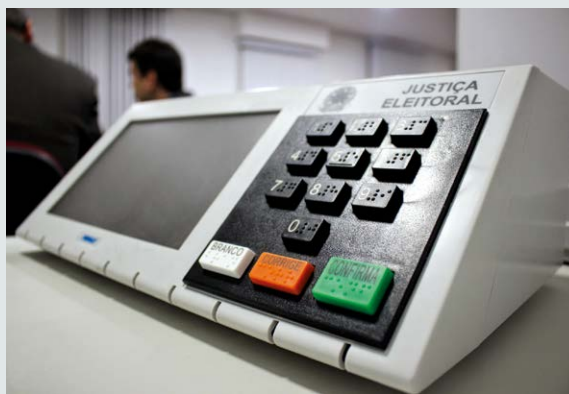
Urna eletrônica Brasileira

novador Trabalhista Brasileiro (PRTB) fará sua convenção e no dia 15 de setembro o Democratas (DEM). O PT deve realizar uma convenção virtual no próximo domingo, dia 13 de setembro.