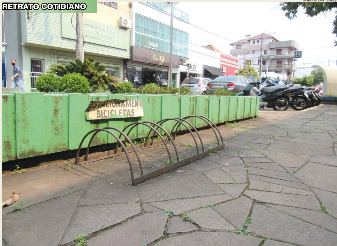
Estacionamento de bicicletas no calçadão de Santo Ângelo, Rua 25 de Julho