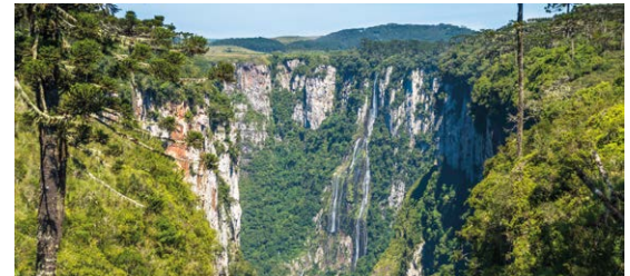
Itaimbezinho - Aparados da Serra

O Sesc/RS retoma os pacotes. As ações estão sendo pensadas com cuidado e adaptadas ao momento atual para valorizar as cidades gaúchas. Gramado, Torres, Tramandaí, Machadinho e Marcelino Ramos estão entre as opções para os próximos meses, assim como as cidades do estado vizinho Florianópolis, Lages e Blumenau.