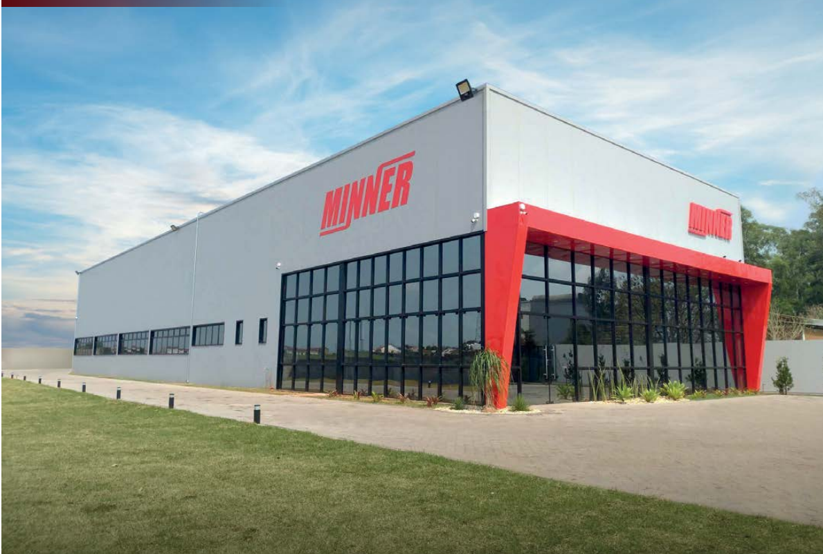
Sede da Minner, localizada na Rua José Alves Batista, 163, Bairro Aliança em Santo Ângelo/RS

A Minner deu um grande passo na trajetória de 10 anos. Apresenta a sua nova sede que agora está localizada na Rua José Alves Batista, 163, Bairro Aliança em Santo Ângelo/RS, próximo a Fundimisa. O novo espaço é mais amplo e foi projetado para proporcionar melhor organização.