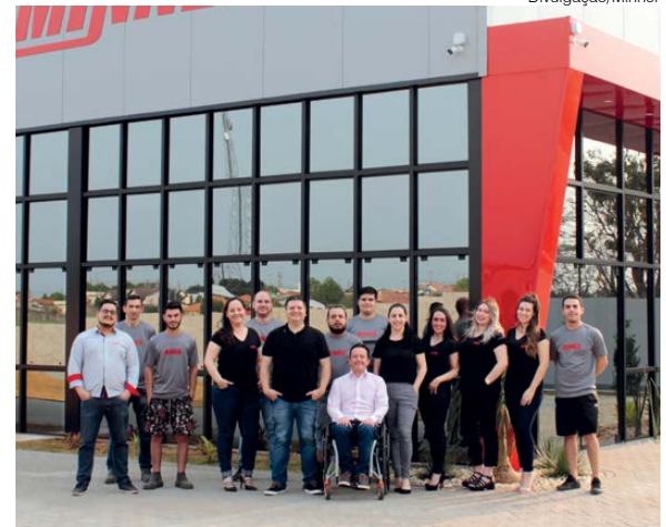
Diretoria e colaboradores da Minner