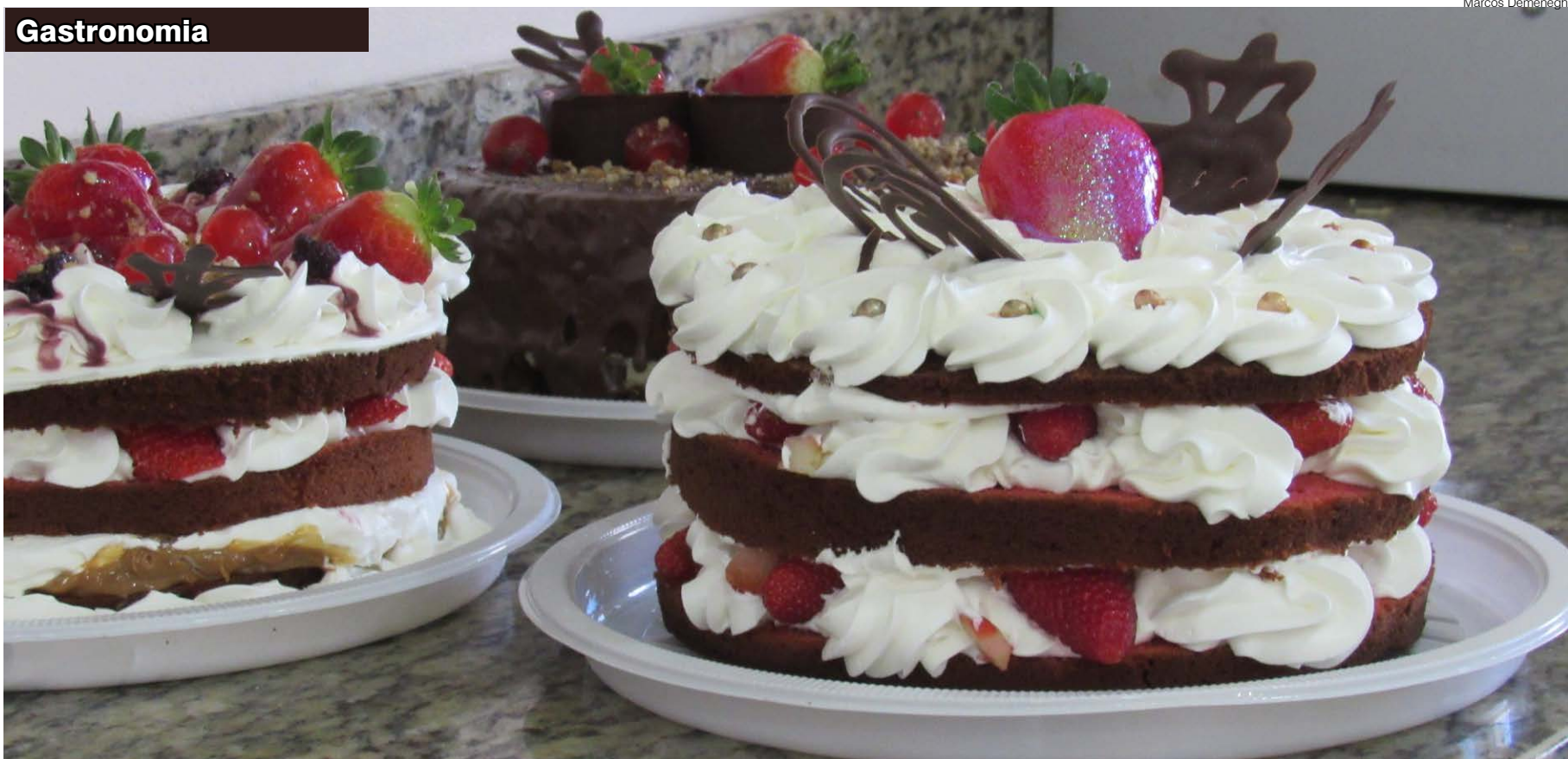
Torta confeitada na Padaria Paladar em Santo Ângelo