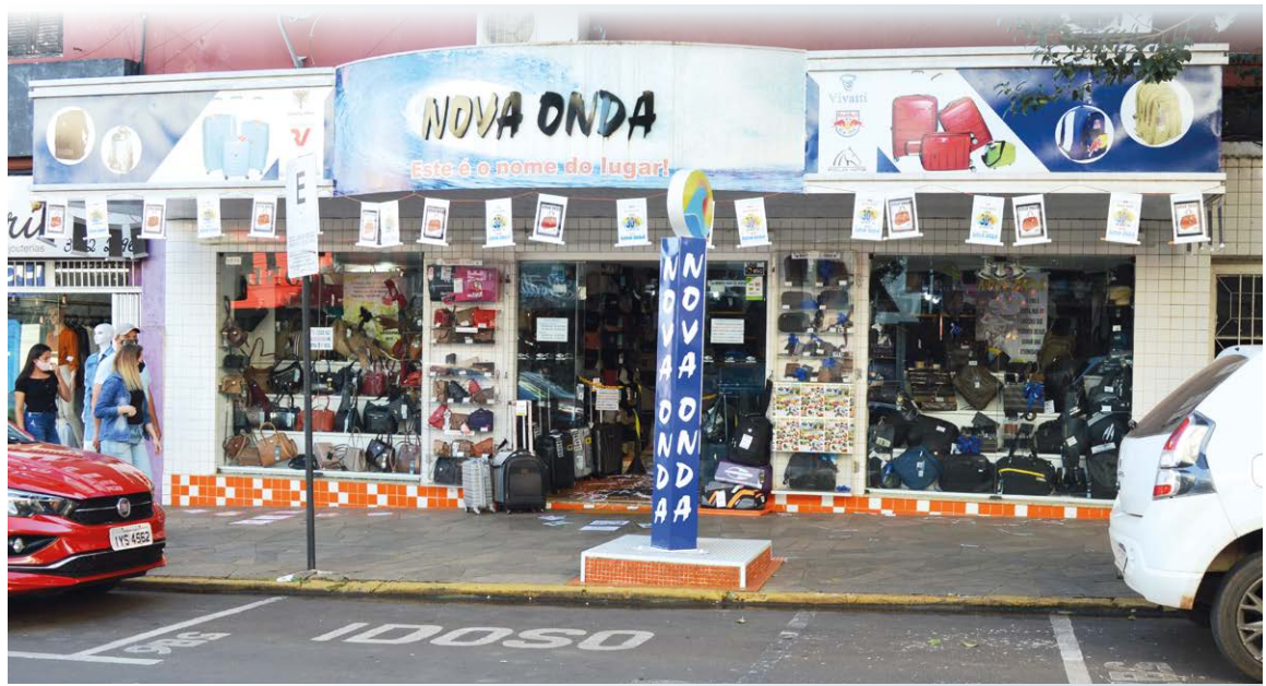
Loja Nova Onda na Rua Marquês do Herval, 1516 em Santo Ângelo, telefone (55) 3313-1381

Com todos os protocolos de segurança, como o controle de fluxo de pessoas, higienização, uso da máscara e a manutenção do distanciamento a Nova Onda está aberta para a população, inclusive neste sábado à tarde para facilitar a compra do presente para o dia dos pais.