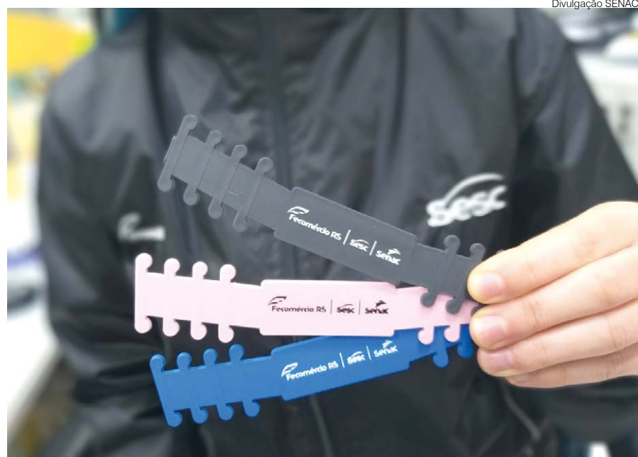
O modelo de extensor distribuído pode ser fabricado em impressora 3D

Em todo o estado são distribuídos 85 mil extensores de máscaras. O material é de fácil colocação e permite que a pessoa permaneça com a sua máscara por mais tempo, sem manuseá-la, evitando os ferimentos que as hastes dos tecidos têm causado devido ao uso prolongado.