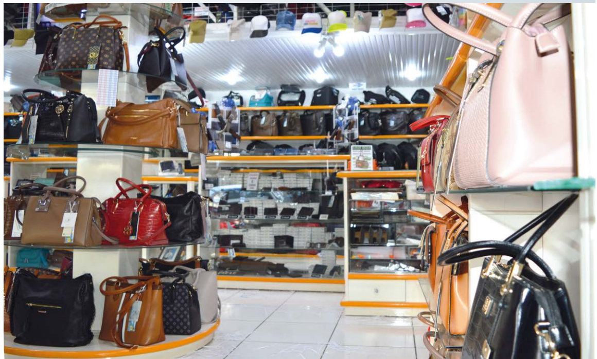
Interior da loja - Nova Onda