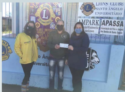
Entrega do cheque simbólico à AMPARK