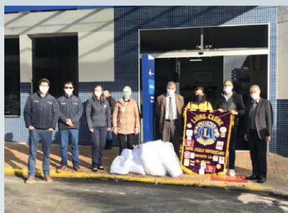
Entrega de tecido ao HSA