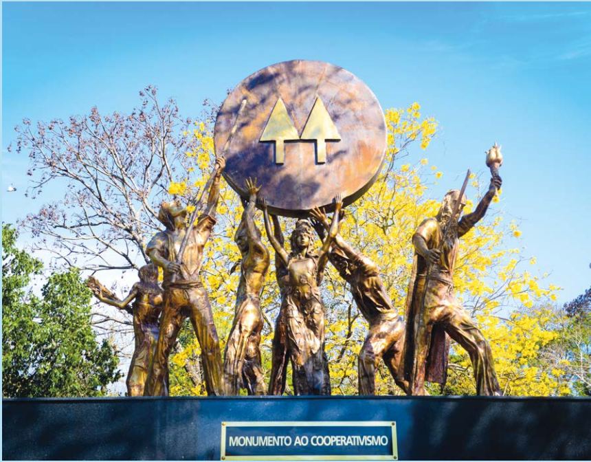
Monumento ao Cooperativismo em Cerro Largo

A Sicredi União RS tem sua origem no ano de 1913 e no dia 06 de julho, segunda-feira, completa 107 anos. Atua com sistema cooperativo e já conquistou 144 mil associados. É uma das 110 cooperativas integrantes do sistema Sicredi e está presente em 39 municípios das regiões Noroeste e Missões com 45 agências e uma equipe de aproximadamente 700 colaboradores