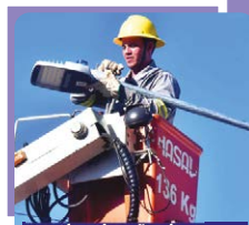
Modernização da Iluminação Pública