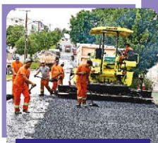
330 quadras asfaltadas