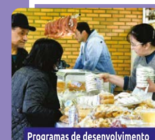
Programas de desenvolvimento das agroindústrias e da agricultura familiar