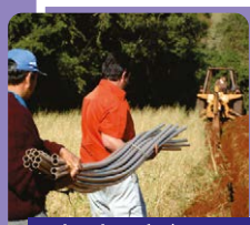
22 km de rede água para o meio rural