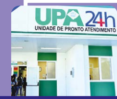
Em breve: UPA 24h