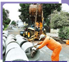
Plano de Prevenção a Alagamentos