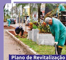
Plano de Revitalização Urbana