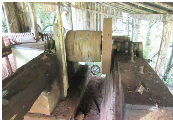
Polias que moviam um antigo moinho na área da cascata