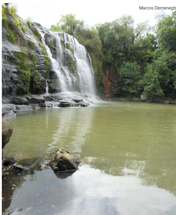
Vista lateral - margem esquerda da cascata