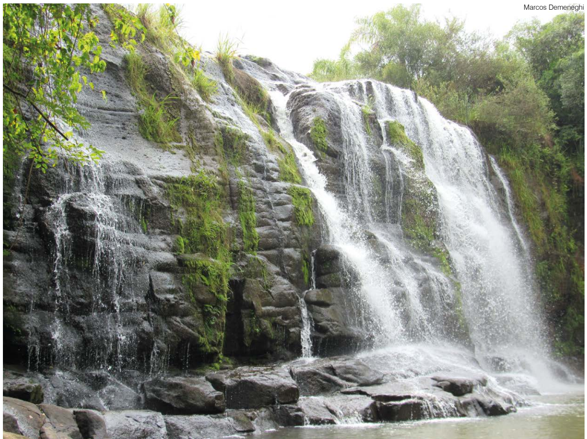
Queda d'água do rio Comandai localizada na divisa de Santo Ângelo e Giruá

Ainda são observados nas imediações da cascata, antigos equipamentos e mobiliário que serviam para gerar energia e mover engrenagens de um antigo moinho, como rodas d'água, turbina, polias, etc.