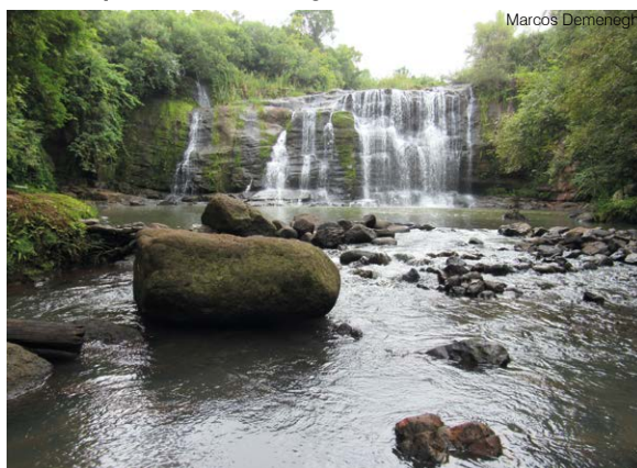
Vista frontal da cascata