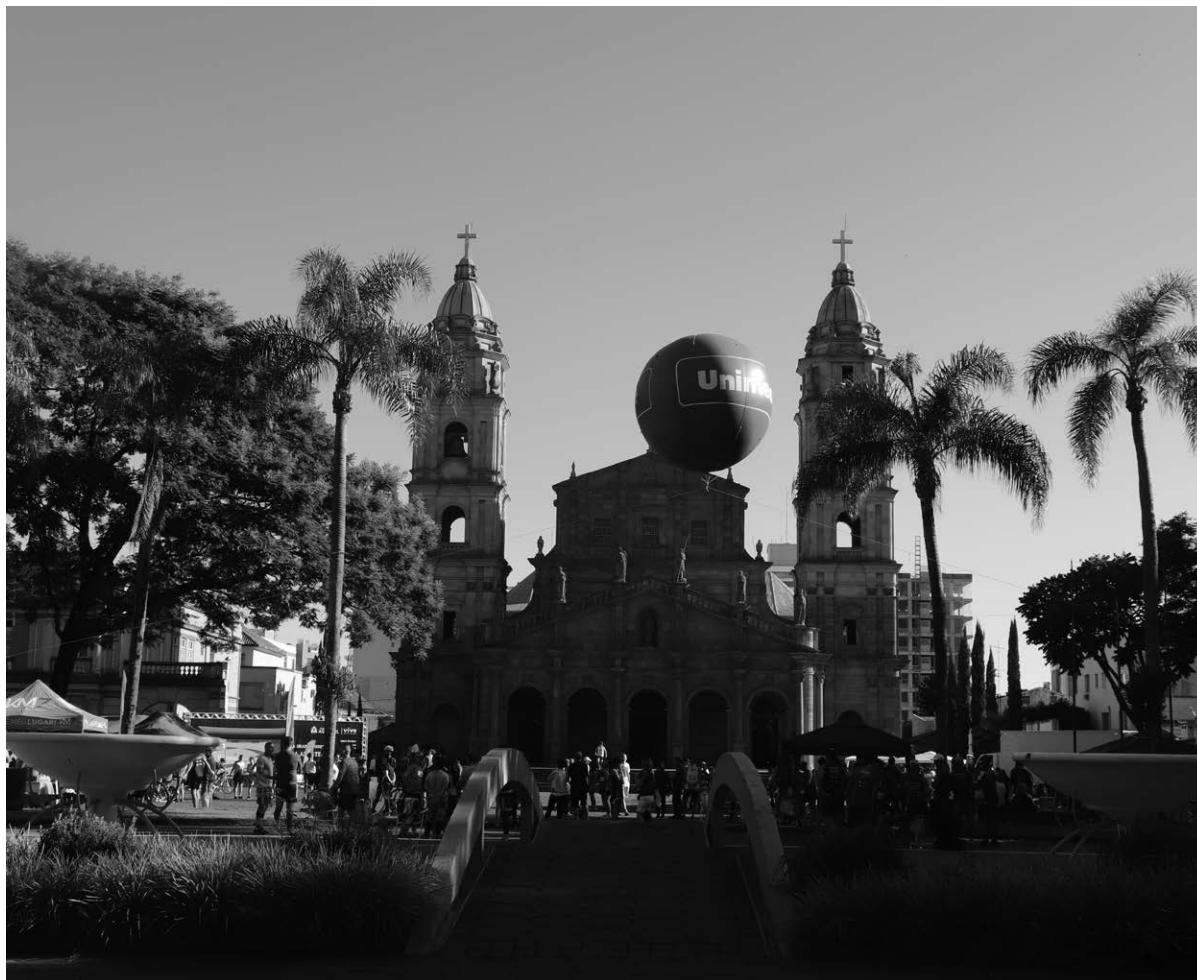
Praça Pinheiro Machado em Santo Ângelo, local onde será a concentração dos atletas para a largada

Santo Ângelo será sede da segunda etapa do 9º Circuito Regional de Corrida de Rua, que será realizada no dia 22 de março.