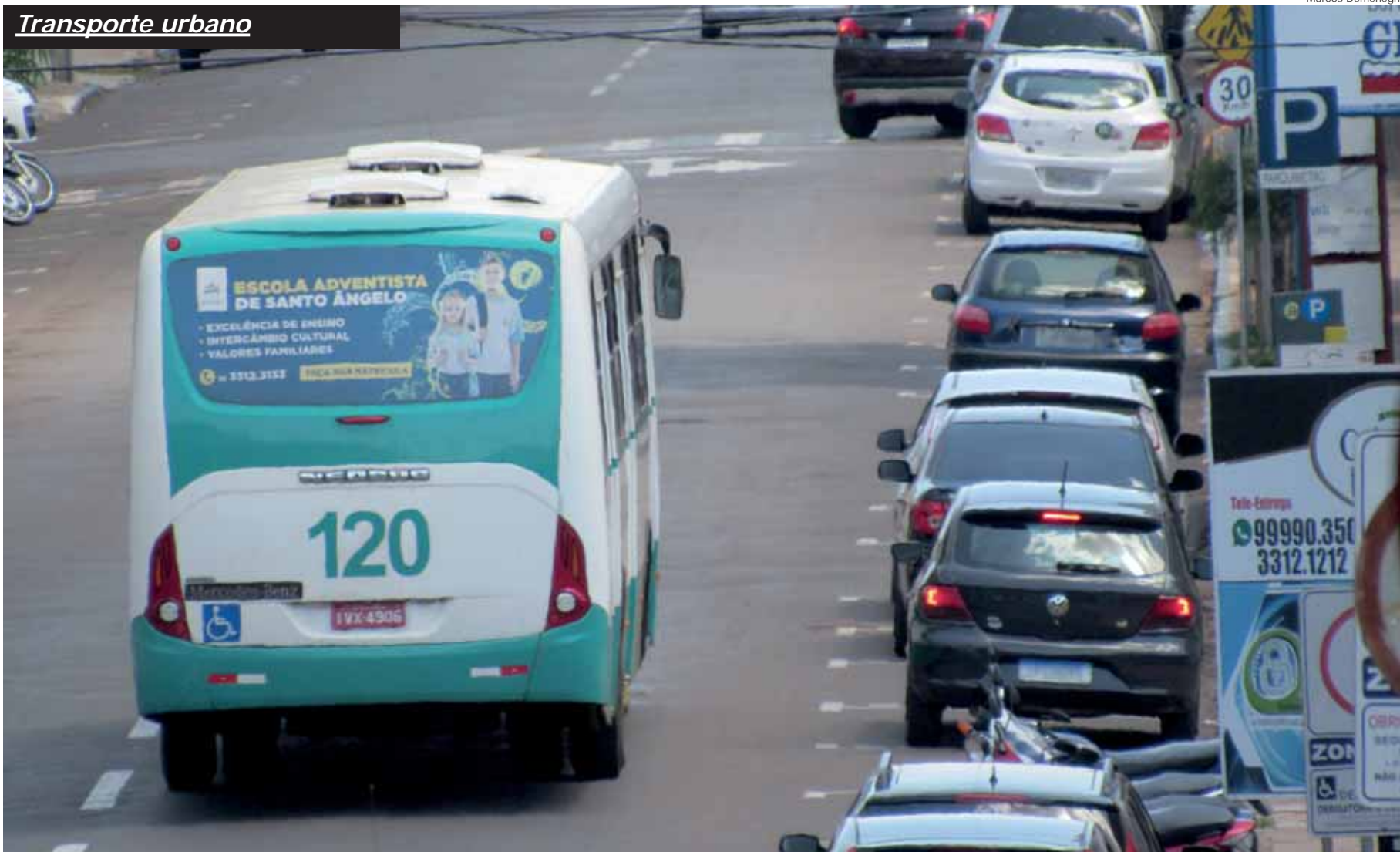
Ônibus da Viação Tiaraju em trânsito pela Rua Marechal Floriano