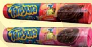
BISCOITO TORTUGUITA 130G