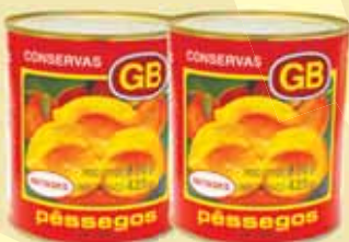
PÊSSEGO CALDA GB METADES 425G