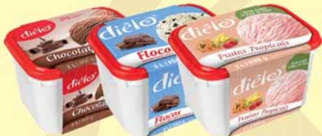
SORVETES DIELO 2L