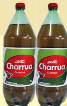
REFRIGERANTE GUARANÁ CHARRUA 2L