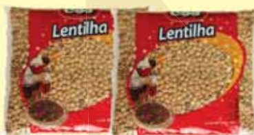
LENTILHA CBS 500G