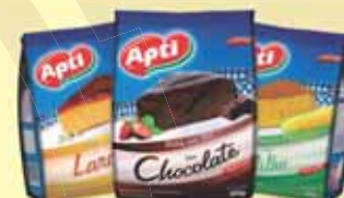
MISTURA PARA BOLO APTI 400G