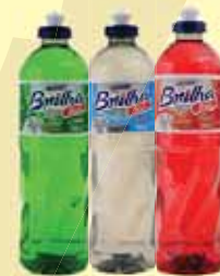
DETERGENTE BRILHA SUL 500ML