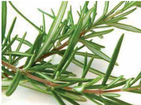
Alecrim (Rosmarinus officinalis)