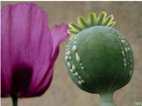
Papoula (Papaver somniferum)