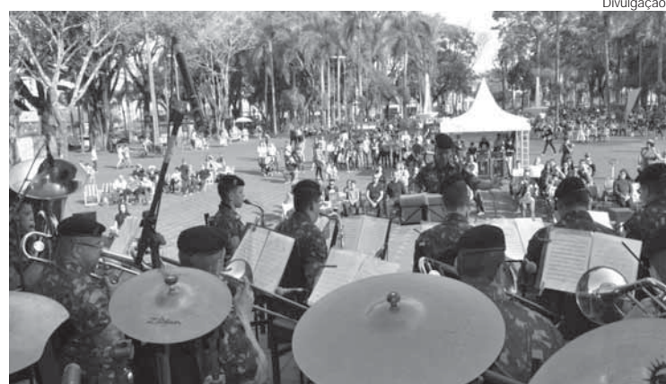
Praça Pinheiro Machado

No dia 25 de agosto, teve início às 16 horas, o concerto sinfônico "A Banda Toca com os Amigos" como parte das comemorações da Semana do Soldado, marcando, também, o Centenário da Presença do Exército Brasileiro em Santo Ângelo. O evento foi realizado na Praça Pinheiro Machado, em frente à Catedral Angelopolitana.