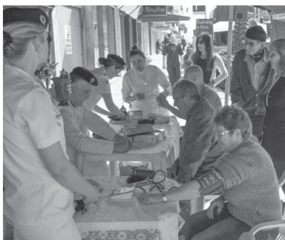
Posto médico da guarnição de Santo Ângelo na Praça do Brique realizando ação cívico-social