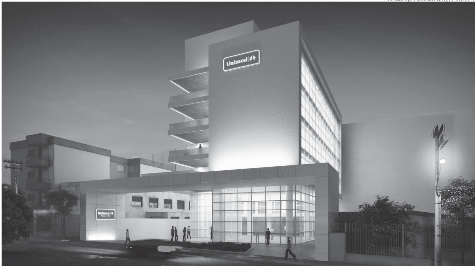
Projeto de ampliação do Hospital Regional Unimed Missões

Unimed/Imagem renderizada do Projeto Arquitetônico