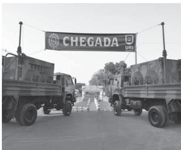
A concentração foi realizada na Av. Venâncio Aires

Na manhã do dia 26 de agosto, foi realizado durante o "Brique da Praça" na praça Leônidas Ribas, uma Ação Cívico Social (ACISO), pelo Posto Médico da Guarnição de Santo Ângelo (PMedGuSA). Na oportunidade foram realizadas orientações sobre saúde médica e odontológica, 70 (setenta) aferições de pressão arterial, 82 (oitenta e dois) testes de taxa de glicemia e 21 (vinte e uma) análises de tipagem sanguínea.