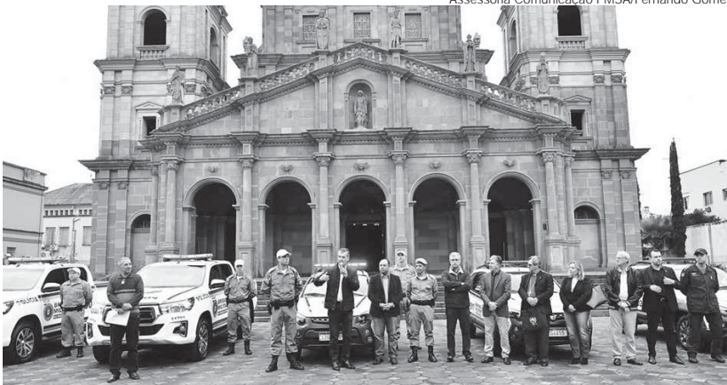
Autoridades durante a cerimônia de entrega das viaturas