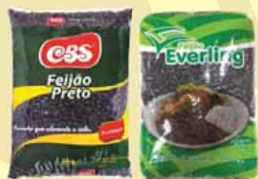
FEIJÃO PRETO CBS E EVERLIN 1KG