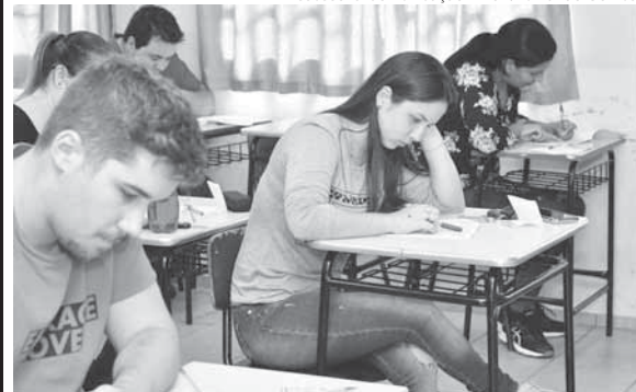
Candidatos durante o Processo Seletivo