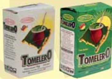
ERVA MATE TOMELERO 1KG