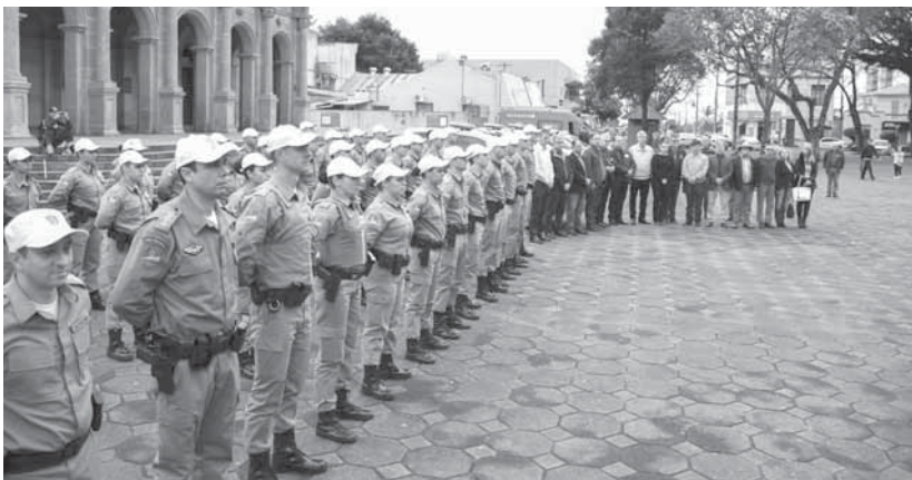
Policiais durante a homenagem aos soldados mortos em serviço