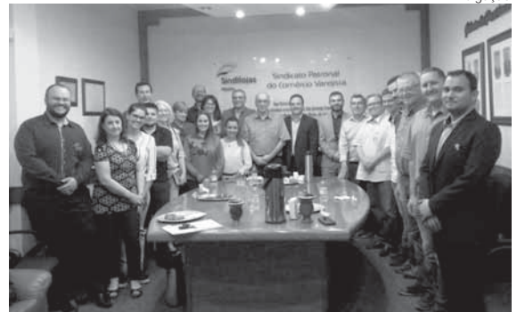
Hora do Mate foi realizada na quinta-feira, dia 27

Foi realizado na quinta-feira, dia 27, na sede do Sindiloja Missões, mais um encontro mensal da Hora do Mate. A iniciativa foi realizada com a intenção de debater as demandas dos empresários locais, trocar experiências entre os diferentes setores do comércio além de aproximar a entidade de seus associados e colaboradores.