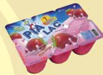
BEBIDA LACTEA PIA LAC MORANGO 540G