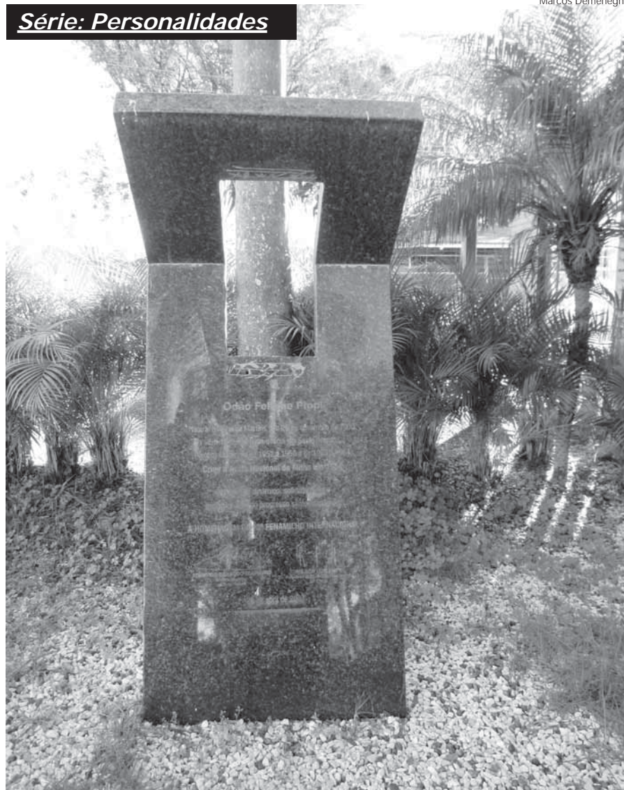
Base de granito instalado no Parque de Exposições Siegfried Ritter