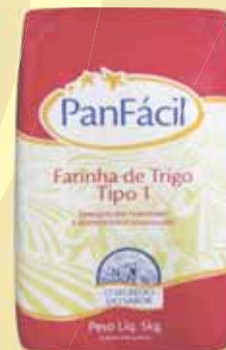
FARINHA DE TRIGO PANFÁCIL 5KG