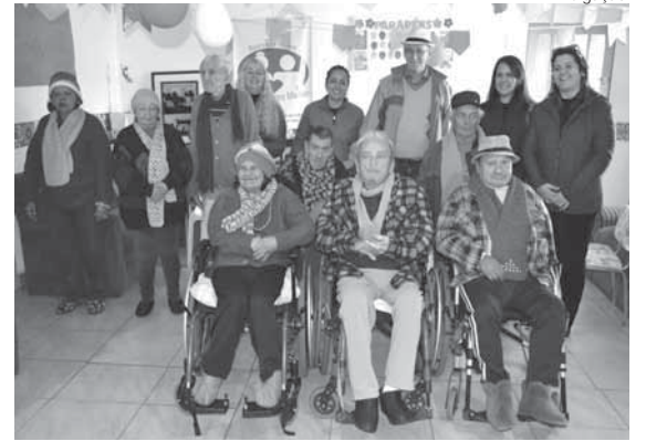
Momento da entrega das peças

Com a chegada do frio, esposas de militares do 1º B Com e demais Organizações Militares da Guarnição de Santo Ângelo, que participam do Grupo Costurinha Agulha Forte, Mão Amiga, entregaram na tarde do dia 27 de junho, as peças de tricô e crochê, confeccionadas pelo grupo aos residentes no Retiro de Idosos Universina Carrera Machado de Santo Ângelo.