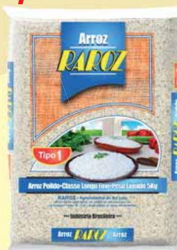
ARROZ RAROZ T1 5KG