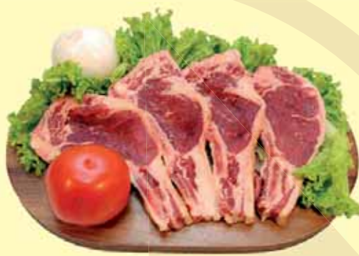
CHULETA BOVINA KG