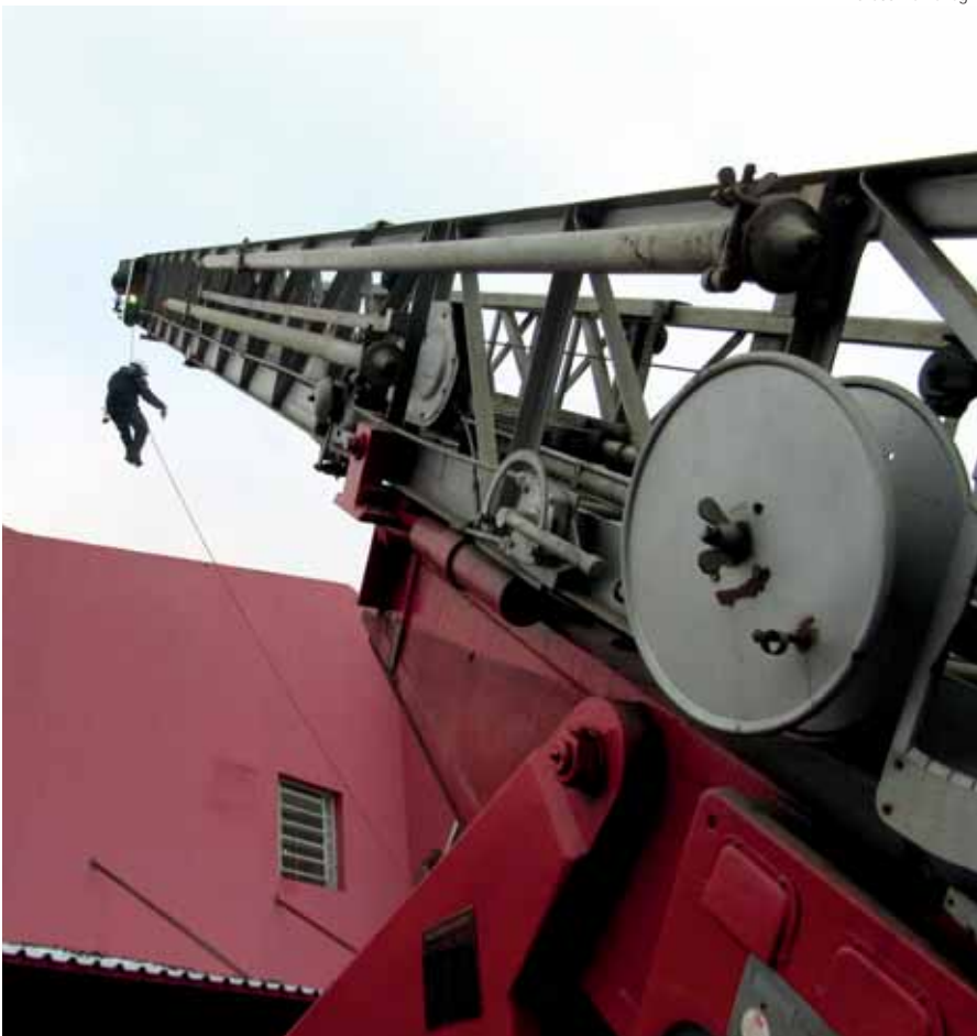
Treinamento de salvamento em altura, realizado no Corpo de Bombeiros de Santo Ângelo

Inicia neste domingo, dia 30, a Semana Nacional de Prevenção contra Incêndio. Em Santo Ângelo, a 1ª Companhia de Bombeiros Militar preparou atividades como apresentações e simulados, desfile do trem de socorro, abertura do quartel para visitação, além de vistorias e ações de conscientização com panfletagens nos principais pontos da cidade.