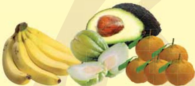
BERGAMOTA POKAN, BANANA CATURRA, ABACATE E CHUCHU KG