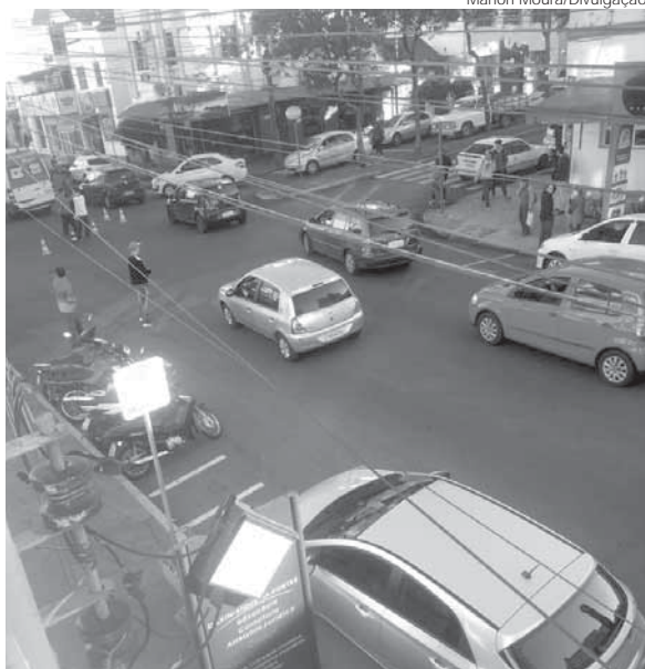
Trânsito ficou lento na segunda-feira, dia 15, após a colisão no cruzamento da Rua Marechal Floriano com a Sete de Setembro

A colisão resultou em ferimentos nos dois motoristas, que foram atendidos pelo Corpo de Bombeiros e pelo SAMU.