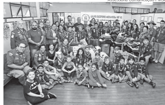
Escoteiros no momento da doação

O Grupo Escoteiro Medianeira realizou na tarde do sábado, dia 13, a entrega de mais de mil peças de doações para a Central do Bem. A entrega foi realizada na sede do Grupo, localizada no Centro Municipal de Cultura, precedida por um ato cívico promovido no lado externo.