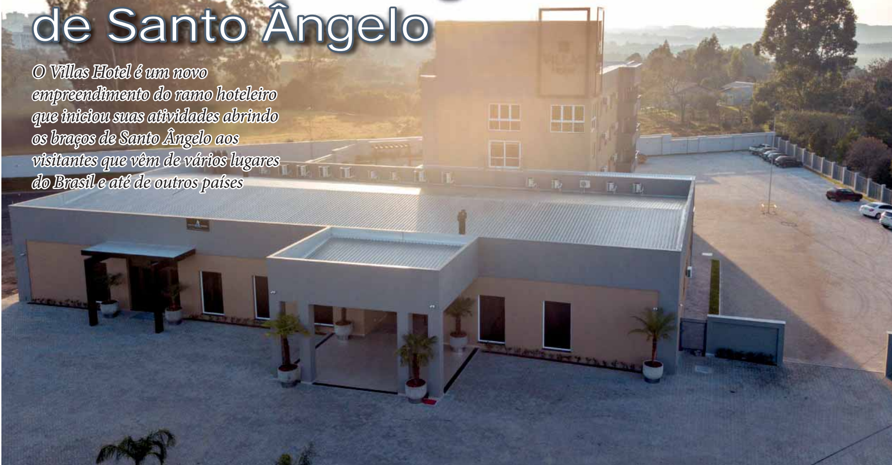
Villas Hotel localizado próximo ao acesso principal da cidade de Santo Ângelo, na rótula da ERS 344 com a Av. Ipiranga

O Villas Hotel é um novo empreendimento do ramo hoteleiro que iniciou suas atividades abrindo os braços de Santo Ângelo aos visitantes que vêm de vários lugares do Brasil e até de outros países