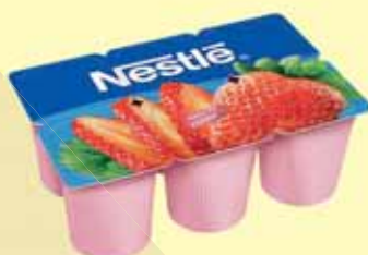
IOGURTE NESTLÉ 540G