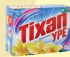
DETERGENTE EM PÓ TIXAN 1KG