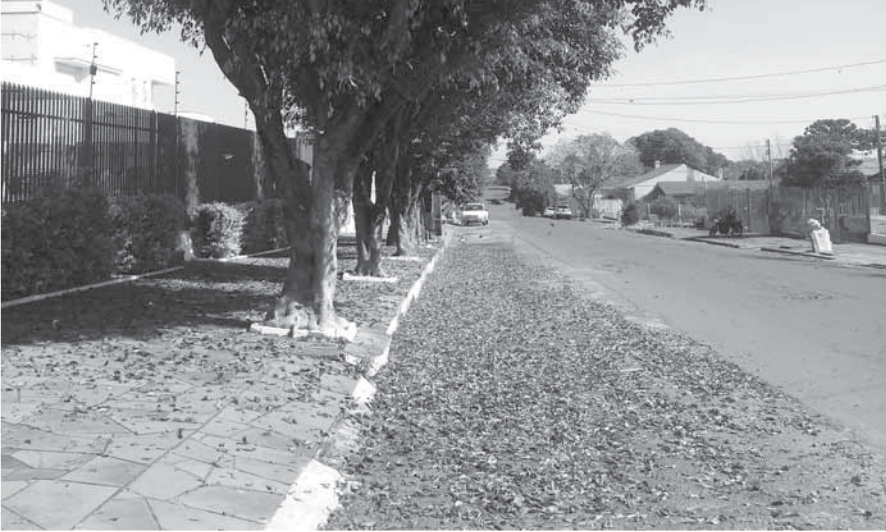
Folhas de Ficus na Rua Andradas

Ao passear pela cidade nesta semana foi comum encontrar trechos cheios de folhas verdes no chão.