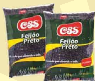
FEIJÃO PRETO CBS T1 1KG