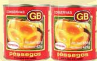
PÊSSEGO CALDA GB ESPECIAL 450G