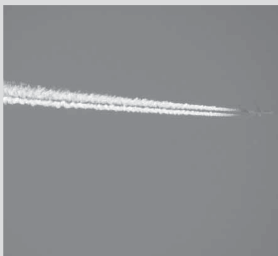
Avião da TAM, fotografado enquanto deixava Rastro de Condensação na última quinta-feira, dia 11