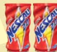
ACHOCOLATADO NESCAU 2.0 200G