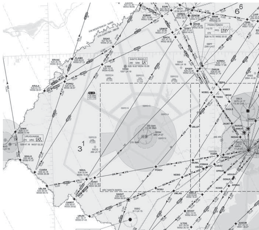
Trecho de Carta de Rotas, que apresenta as Aerovias que passam próximas de Santo Ângelo

Além disso, as aeronaves também podem viajar em velocidades diferentes, dependendo da autonomia de cada modelo de avião.