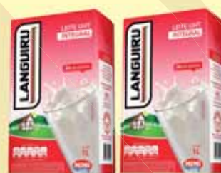
LEITE LANGUIRU INTEGRAL