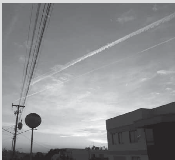
No final da tarde da quarta-feira, dia 10, foi possível observar diversos rastros no céu de Santo Ângelo