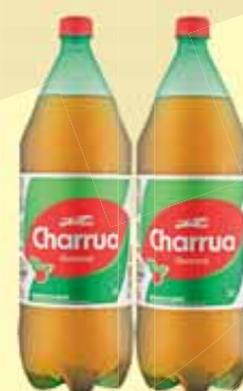
REFRIGERANTE GUARANÁ CHARRUA 2L