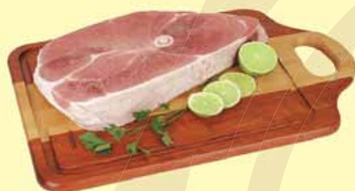
PERNIL SUÍNO KG