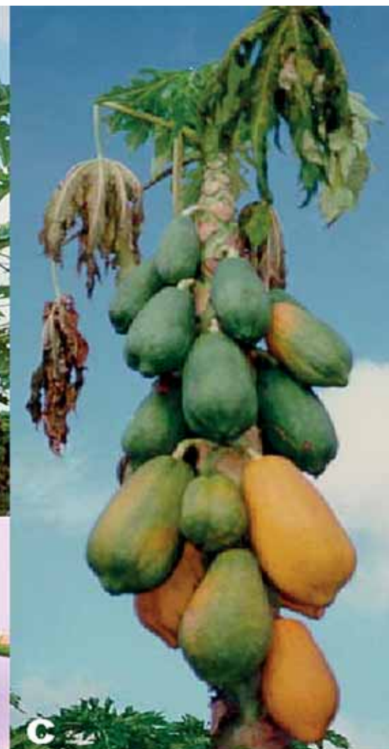
Sintomas do amarelo letal nas folhas e frutos de mamoeiros (Carica papaya)