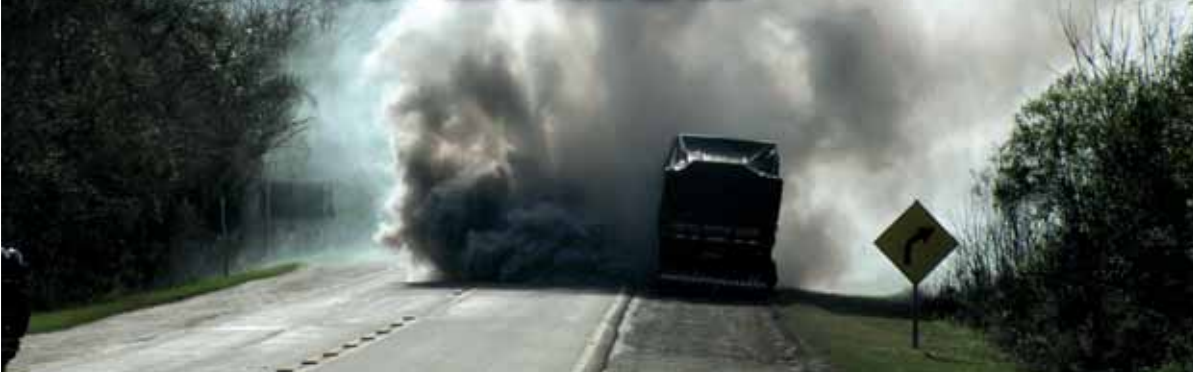
Foto "Salvem o planeta deste escapamento"

No Brasil, as mortes em decorrência da poluição atmosférica aumentaram 14% em dez anos. Nesse período, o número de óbitos por Doenças Crônicas não Transmissíveis (DCNT) passou de 38.782 em 2006 para 44.228 mortes em 2016. A constatação é do estudo Saúde Brasil 2018, do Ministério da Saúde, que utilizou dados do Sistema de Informações sobre Mortalidade (SIM). O número de mortes evitáveis por essas doenças cresceu, assim como a exposição ao O 3 (poluição) em todo o país, com destaque para os grandes centros urbanos e estados castigados pelas queimadas.