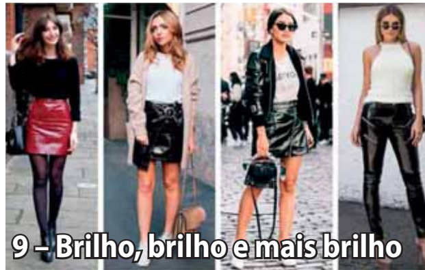
9 - Brilho, brilho e mais brilho

Os acabamentos brilhantes, estarão em alta, sendo uma das tendências da moda inverno 2019. Será sua chance de se destacar com paetês, vinil, efeito holográfico e verniz. Independente do material escolhido, o que realmente importa é estar brilhando. Um dos truques de styling com essas peças é contar com itens brilhantes, combinados com looks total preto ou total branco. Casacos, coletes e saias estarão com tudo!