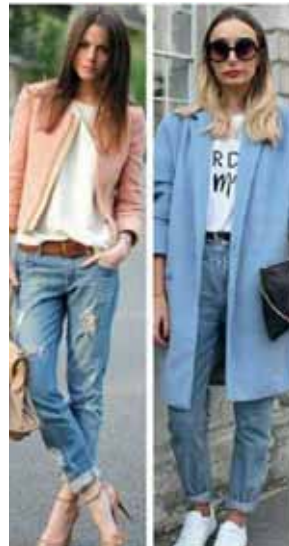
10 - Mom jeans

Uma das peças mais queridas dos anos 80 e 90. A calça conhecida como mom jeans (jeans da mamãe), já aparece como uma tendência e promete se manter para o inverno de 2019. O modelo, se caracteriza por ter cintura alta e corte reto, podendo ser utilizada em produções básicas e em looks com pretensões mais fashionistas. O mais legal, é que além de você encontrar esse modelo em lojas de grifes, também são encontrados com facilidade em lojas de departamento. Cabe no bolso de todo mundo!