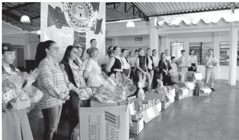
Estudantes a diretoria da escola, apresentando os doces arrecadados