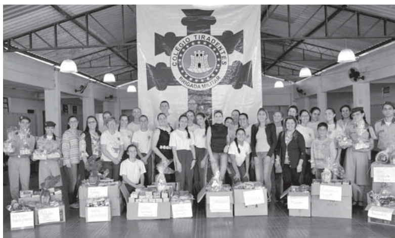
Alunos arrecadaram 796 doces, dentre eles bombons, pirulitos e guloseimas em geral