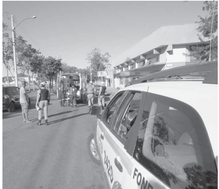
Ocorrência foi atendida por uma equipe da Brigada Militar e do SAMU

Um homem foi baleado em plena luz do dia e na área central de Santo Ângelo. A tentativa de homicídio foi registrada na tarde da quarta-feira, dia 17 e atendida pela Brigada Militar e Samu.