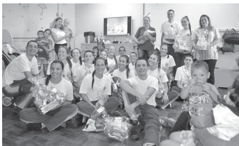
Entrega das doações em uma das creches beneficiadas