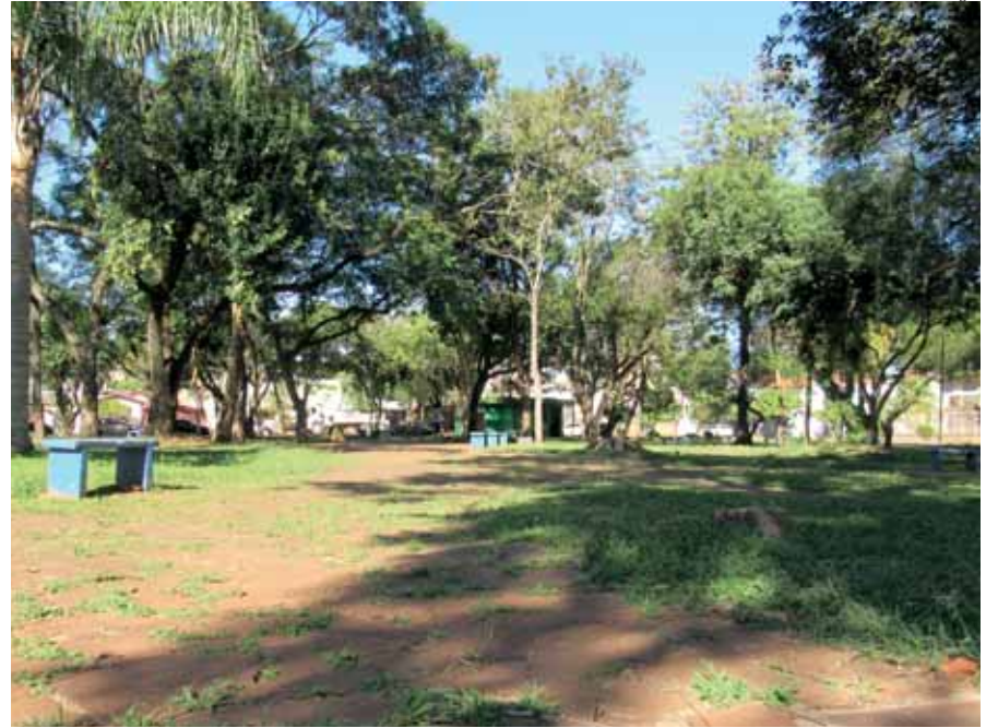
Vista interna da Praça Três Mártires