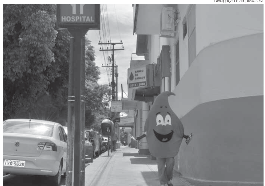
Banco de Sangue fica na Rua Antônio Manoel, no Hospital Santo Ângelo

Para ser um doador, a pessoa precisa estar em bom estado de saúde (não apresentar sinais de resfriado ou alergias); ter dormido bem à noite; não ingerir alimentos gordurosos (quatro horas antes); não consumir bebidas alcoólicas 12 horas antes da doação; não fumar 2 horas antes, entre outros requisitos.