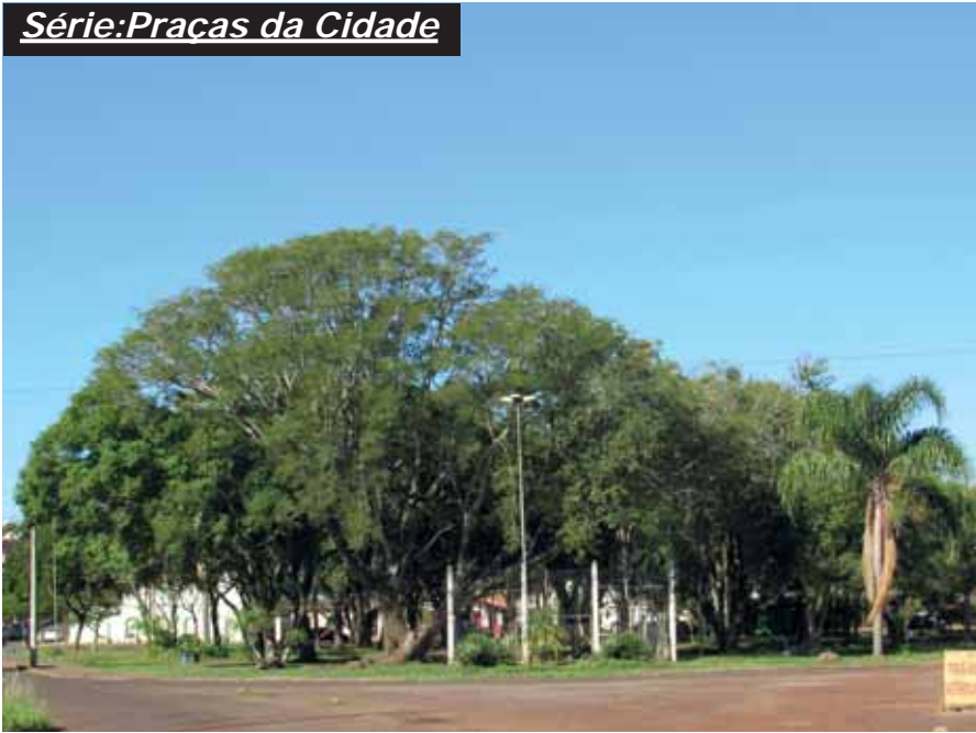
A Praça está localizada em uma área triangular, no extremo da Avenida Brasil