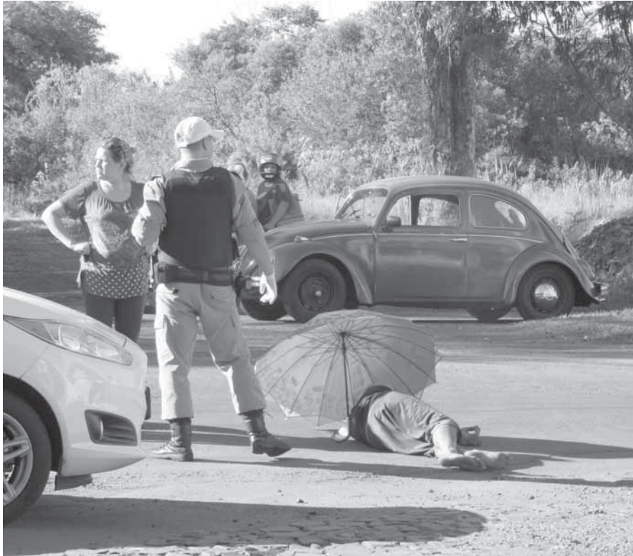
Depois de ser baleado, o homem pediu socorro, jogando-se no asfalto da Avenida Brasil

Depois de levar dois tiros e se esconder no Itaquarinchim, um homem pede socorro na Av. Brasil