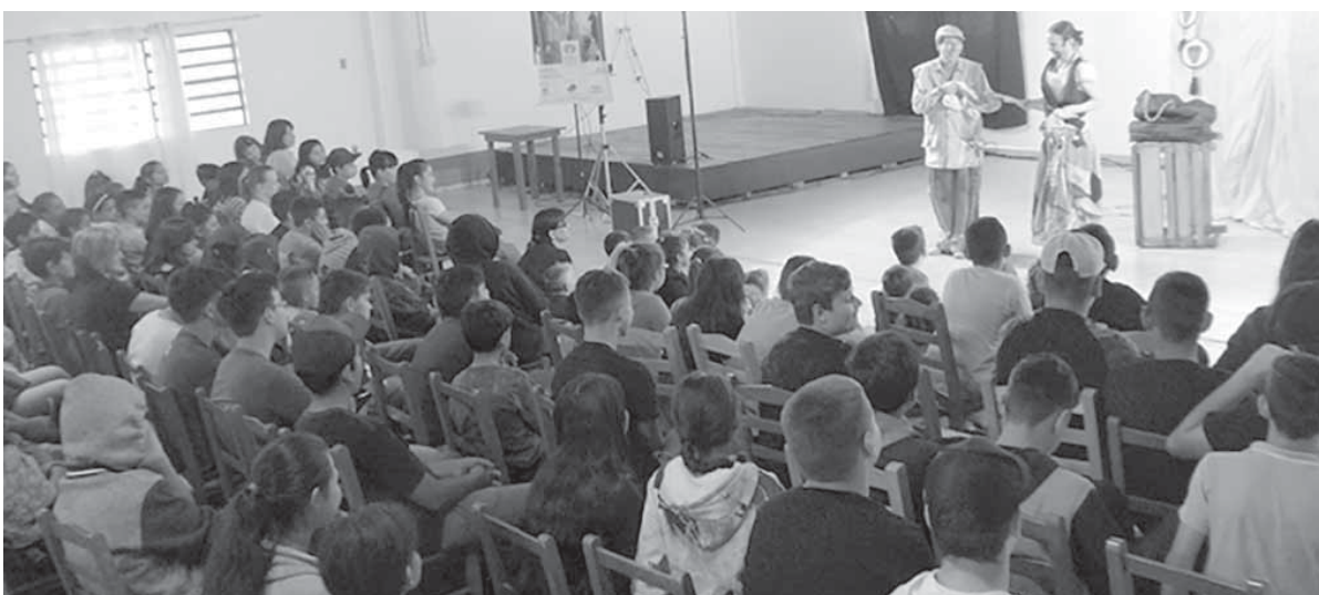
“As Peripécias de Juju e Chimia” já foi apresentado para o público dos bairros de Santo Ângelo: Dido, Aliança, São Carlos e Piratini