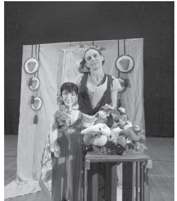
No projeto Comida e Arte são usadas diversas linguagens artísticas, uma delas, são os bonecos

O Grupo de Teatro A Turma do Dionísio foi fundado em 1986, em Santo Ângelo – RS e realizou 2.350 apresentações, para 650 mil espectadores no Brasil (estados do Rio Grande do Sul, Santa Catarina, Paraná, Mato Grosso do Sul, São Paulo, Minas Gerais, Espírito Santo e Brasília), na Argentina, Bolívia, França, Suíça, Polônia, Ucrânia e Itália.