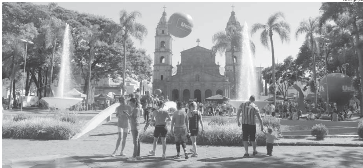
Durante o evento, foi realizado o 8º Circuito Regional de Corridas de Rua, que contou com a participação de 400 atletas

A Praça da Catedral (Pinheiro Machado) foi o palco da comemoração dos 47 anos da Unimed Missões/RS, realizada no domingo, dia 24. O dia de sol colaborou para que o público estivesse presente para aproveitar as inúmeras atrações proporcionadas pela cooperativa.