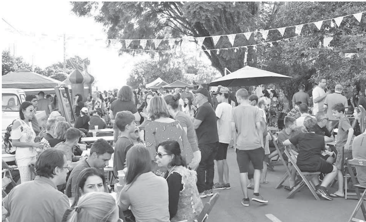
Feira foi realizada no sábado, dia 23, na Rua Marechal Deodoro

A 1ª Feira de Rua levou a comunidade local para a Marechal Deodoro, no último sábado, dia 23. O evento foi feito entre as ruas Marechal Floriano e Marquês do Herval, e contou com 46 expositores divididos em estandes de artesanato, antiguidades, discos, livros, brechós, praça de alimentação, shows musicais, apresentação da Companhia Circense Burzum, espaço kids com brinquedos infantis, espaço para leitura e pista de skate.