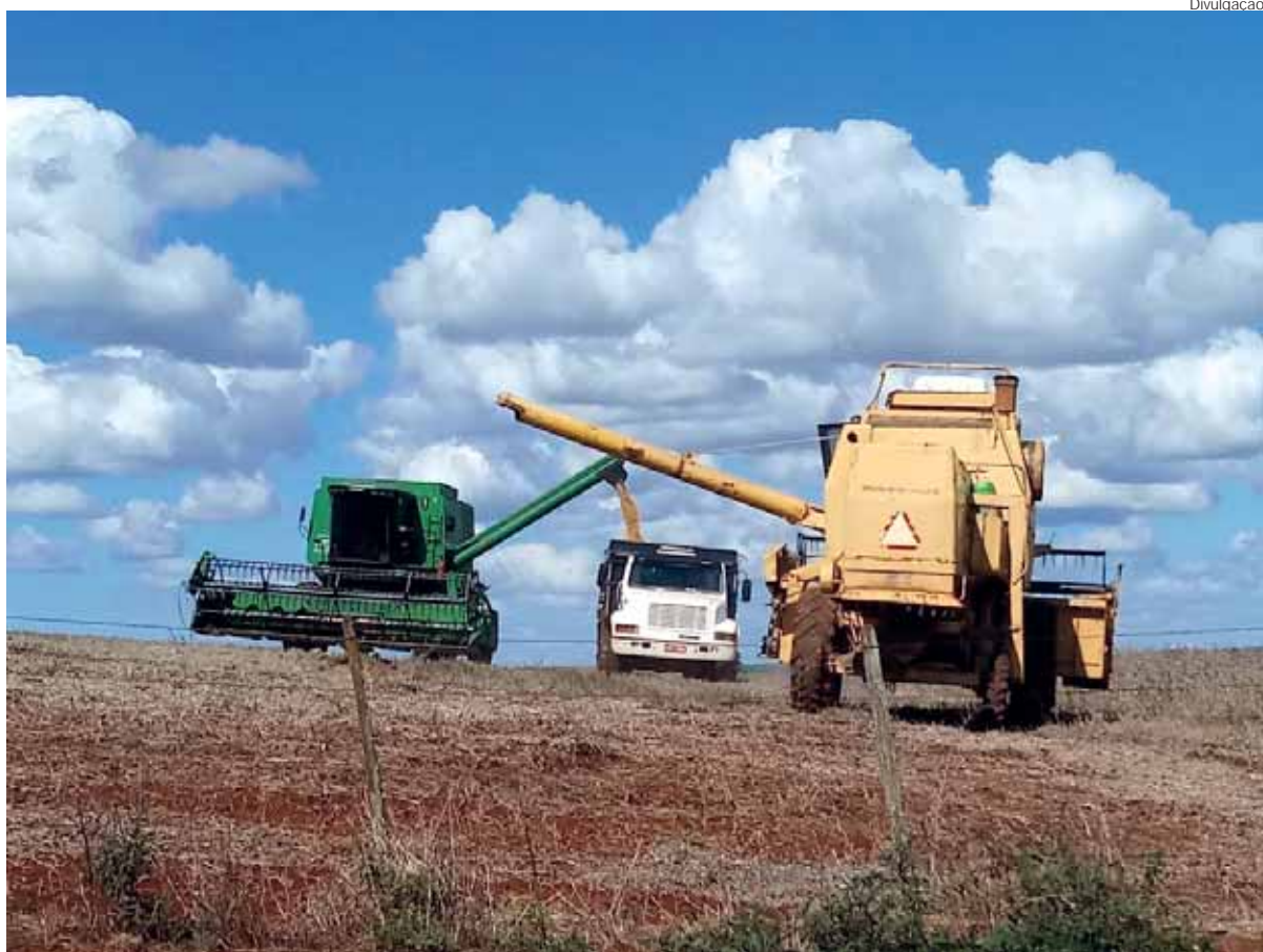
Clima sem chuva garante o trabalho das máquinas nas lavouras Missioneiras

No entanto, segundo análise de agrônomos que acompanham a produção, ainda é cedo para indicar tendências produtivas, pois não há uniformidade de desenvolvimento da cultura em todas as propriedades e regiões do município. Contudo, a expectativa é positiva estima-se que sejam alcançados patamares semelhantes ao do ano anterior, que foi uma das