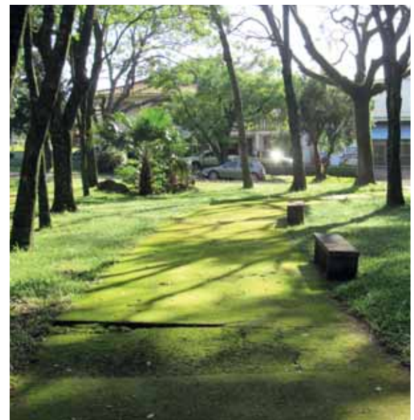
Musgo dá um “toque verde” para o passeio público

A Praça Raul Oliveira também está incluída na lista de locais que receberão recursos para melhorias. Pretende-se investir cerca de R$ 300 mil, aplicados no cercamento, iluminação, acessibilidade e novo piso nas quadras de esporte.