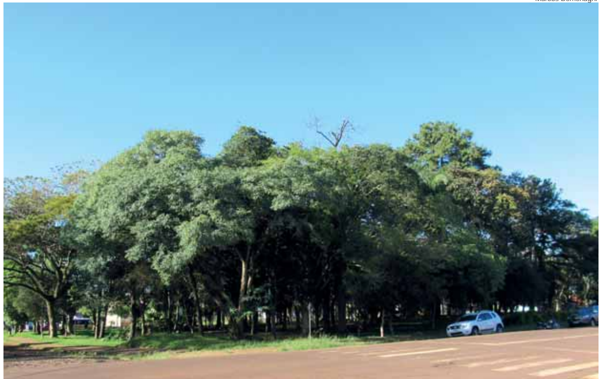
Praça Cel. Raul Oliveira, vista a partir da Rua dos Imigrantes

Segundo levantamento do Projeto Bioflora, da URI Santo Ângelo, na Praça Cel. Raul Oliveira podem ser observadas mais de quarenta espécies arbóreas distintas, com destaque para a predominância