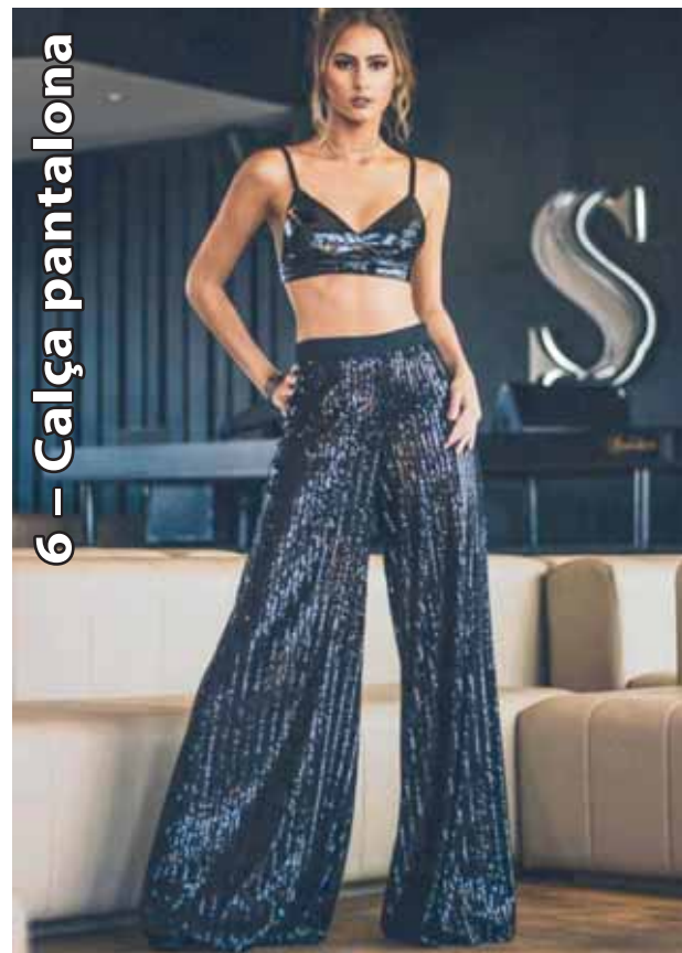
6 - Calça pantalonas

Ao que tudo indica, a calça flare, novamente dará espaço para a pantalonas. E, não é só a barra desse modelo que ganhará um upgrade. As calças que aparecem em destaque, dentre as opções favoritas das fashionistas, tem muito brilho e modelagem diferenciada, mais solta do corpo. O brilho e o mood esportivo estarão com tudo, combine com peças que promovam uma quebra, como camisetas básicas e blazers de alfaiataria. FONTE: Site de Beleza e Moda