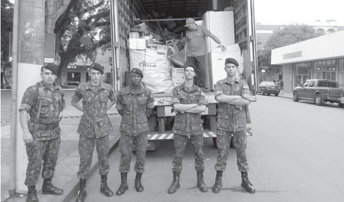
Campanha teve a cooperação de militares do Exército Brasileiro

A Campanha do Lixo Eletrônico recolheu cerca de 32 toneladas de materiais eletrônicos. Essa foi a primeira edição da campanha neste ano e aconteceu durante o sábado, dia 16, na Praça Leônidas Ribas.