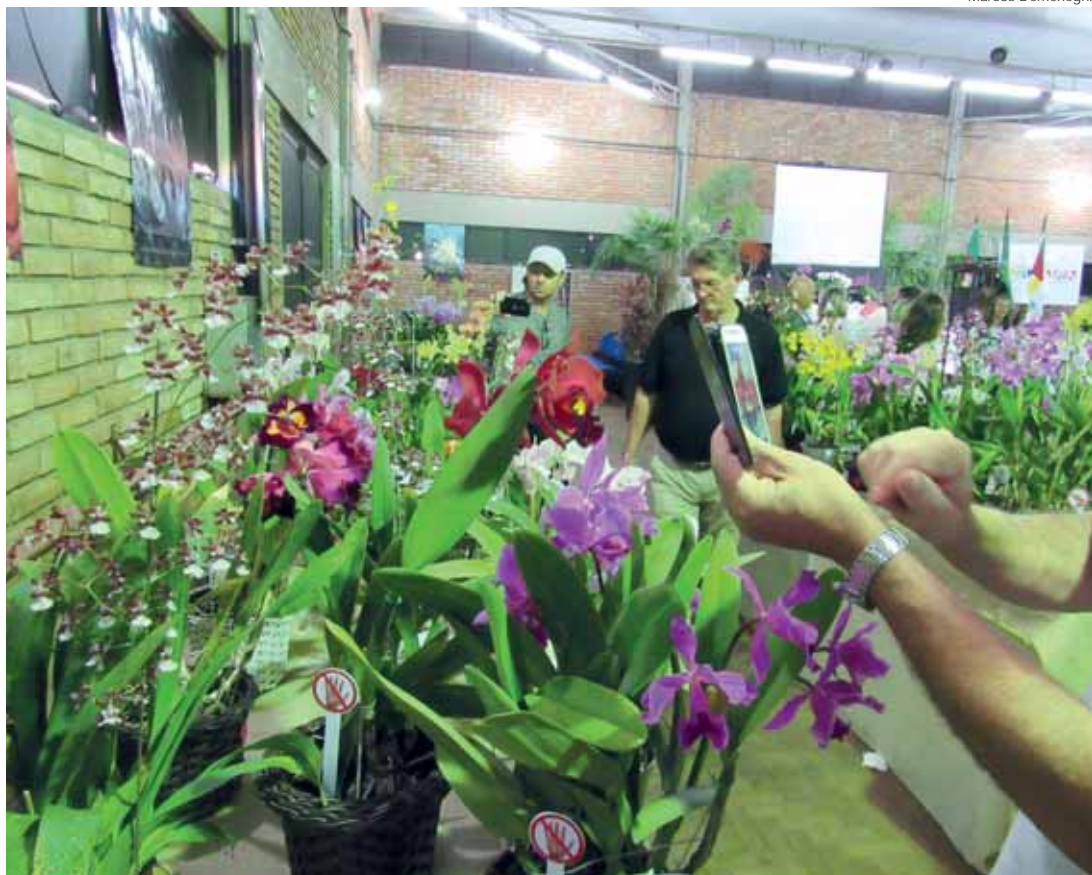
Exposição Regional de Orquídeas no Centro Municipal de Cultura (ilustração 2018)

A exposição está integrando a programação de 146 anos de Emancipação Político-Administrativa de Santo Ângelo e tem o apoio do Governo Municipal com o apoio de parceiros.