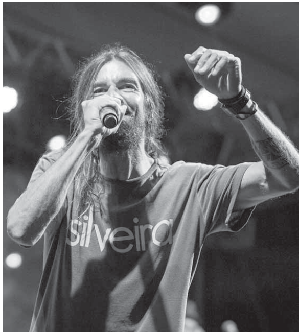
Armandinho se apresentará na Fenamilho, no dia 4 de maio, às 22h

O Anfiteatro será palco dos shows nacionais de Felipe Araújo, Armandinho, entre outros artistas e, nos próximos dias, também devem ser divulgadas as atrações do palco cultural