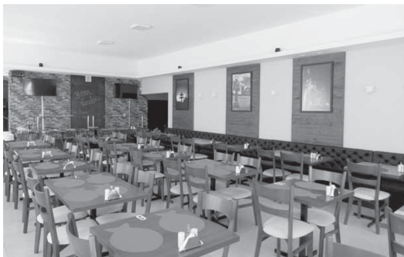
Área interna do Veneza Ristorante

do, o restaurante está localizado na esquina das ruas Antunes Ribas e Sete de Setembro, número 1210 (antigo Restaurante Origens). Mais informações, bem como reservas podem ser feitas pelo telefone: (55) 3313-1415.