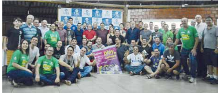
Profissionais da imprensa regional e direção da URI - Câmpus Santo Ângelo na foto coletiva

Fazendo relação com a peça de um equipamento elétrico que estragou, ele disse que "a URI é uma engrenagem que só funciona no conjunto e a imprensa é uma das peças fundamentais da nossa engrenagem".