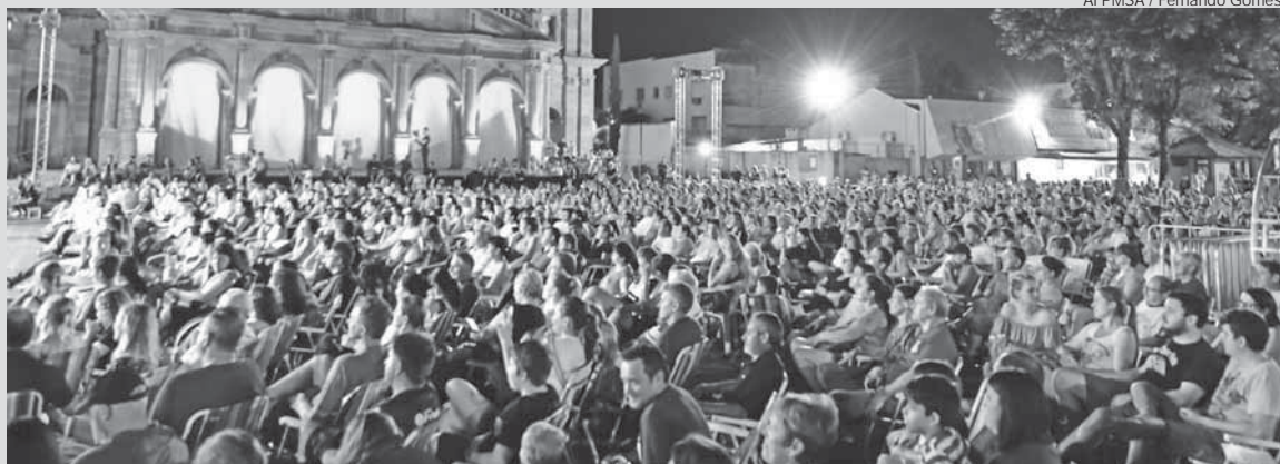
Al PMSA / Fernando Gomes