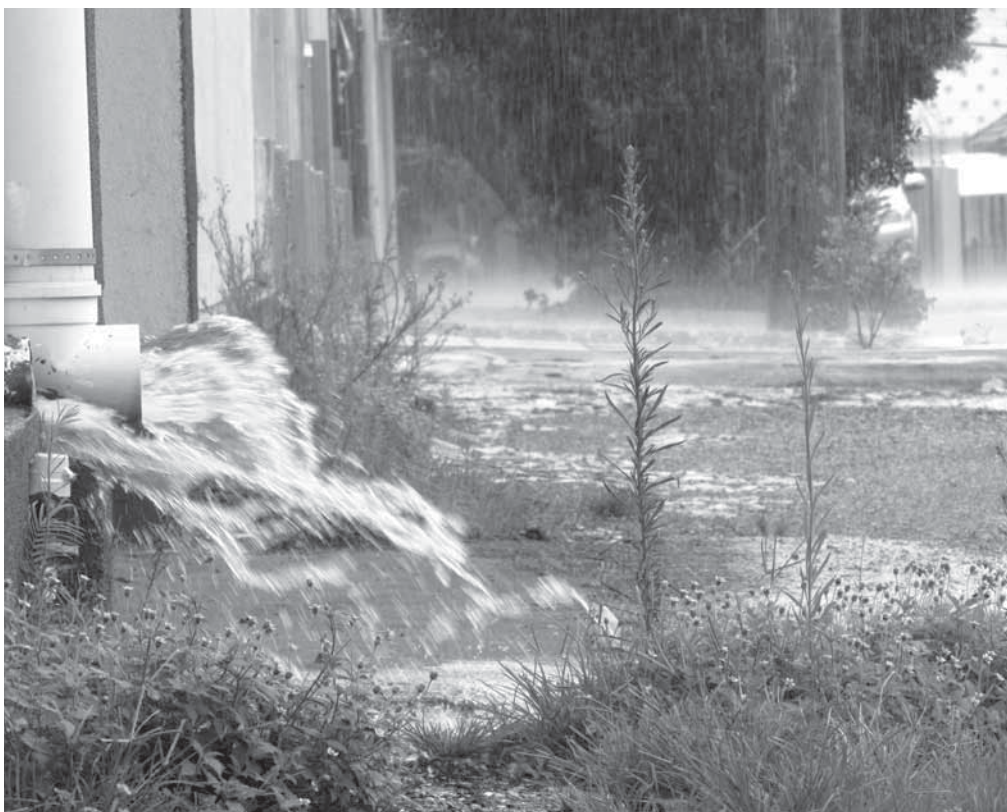
A água doce é procedente de um processo de precipitação (chuva, granizo e neve) ou degelo de geleiras