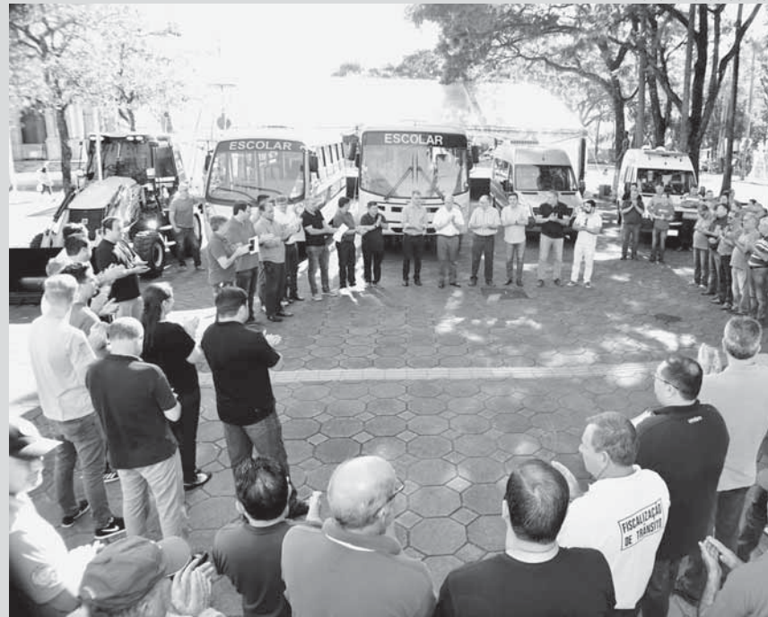
Al PMSA / Fernando Gomes