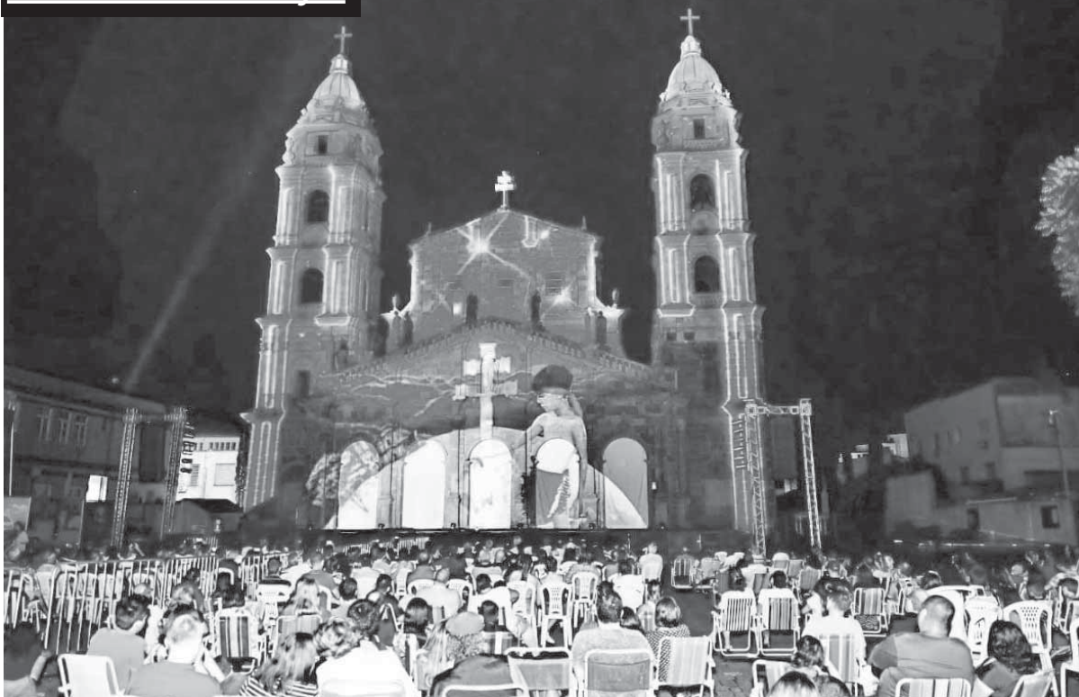
Público prestigiando as apresentações do Natal Cidade dos Anjos