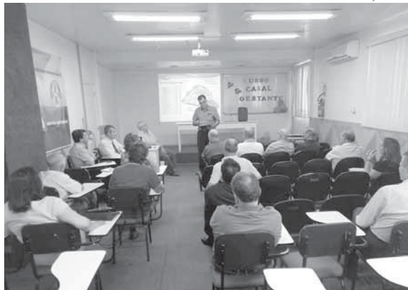
Eleição aconteceu na sexta-feira, dia 30 de novembro, no auditório do HSA

Na oportunidade, o provedor fez um balanço das ações desenvolvidas, destacando as conquistas e desafios, no seu primeiro mandato, e agradeceu a confiança de todos no seu trabalho.