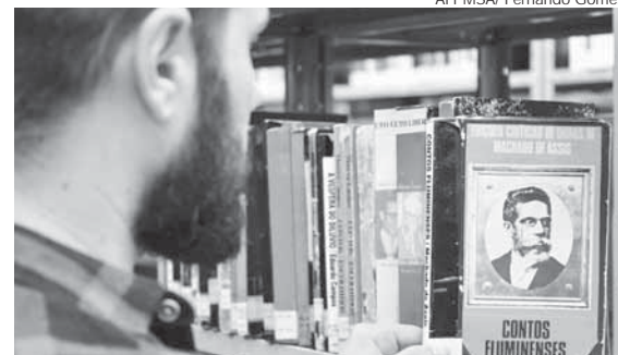
Certame que está em sua 4ª edição aceita produções textuais no gênero Conto até hoje

Os candidatos têm até esta quarta-feira, dia 5, para inscrever até duas produções autorais, dentro das categorias Livre – concorrentes de qualquer idade; e Estudantil-menores de 18 anos, para o 4º Concurso Literário.