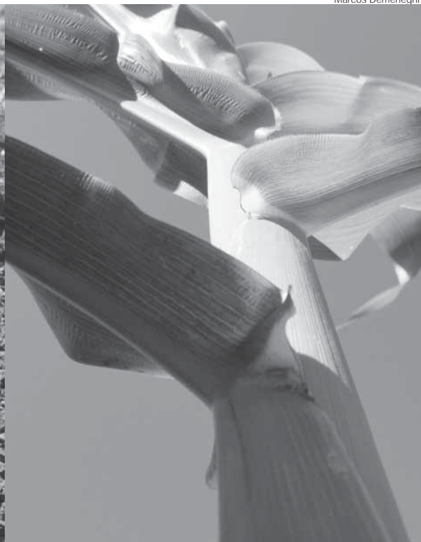
Diferentes áreas e culturas fotografadas no interior de Santo Ângelo nos meses de novembro e dezembro

Até novembro a cor predominante na zona rural era o amarelo ouro do trigo. Tão logo foi colhido, já foram implantadas as lavouras de soja, observamos em menor escala o milho safra que está em avançado desenvolvimento. Acompanhe um breve relato sobre o contexto de cada uma destas culturas e as estimativas de áreas plantadas no município de Santo Ângelo.