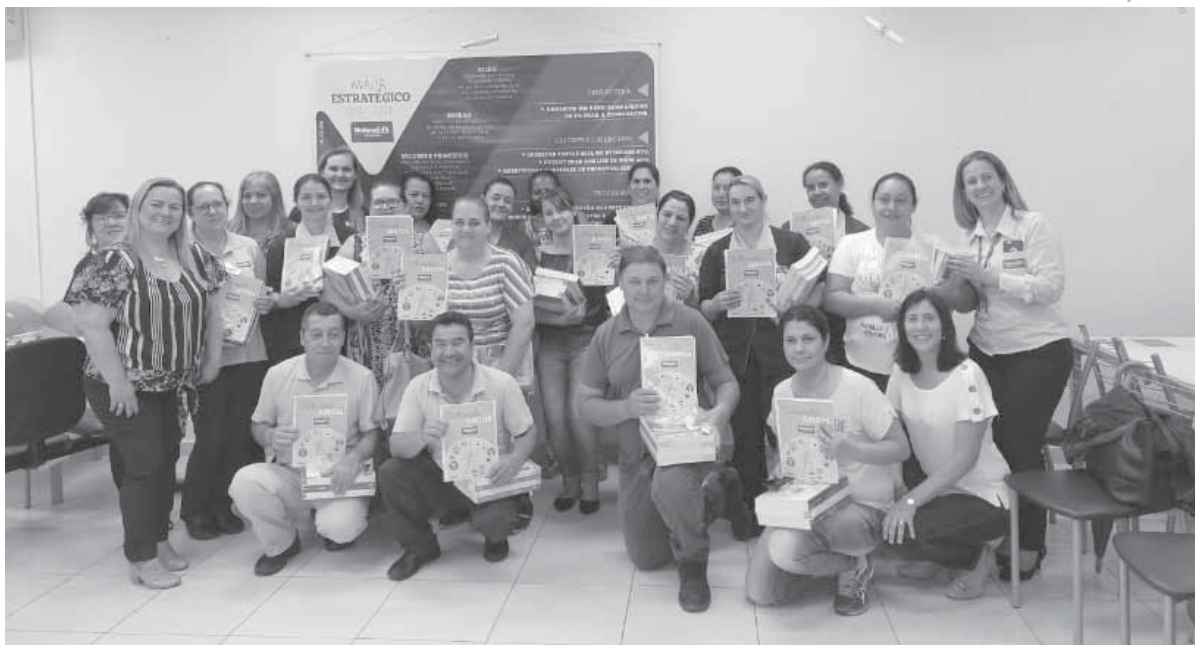
Livros entregues durante o lançamento do projeto

Proporcionar caminhos de crescimento pessoal e profissional às pessoas. Com esse objetivo, a Unimed Missões/RS lançou na última semana o projeto Trilhando Juntos, voltado aos colaboradores da cooperativa.