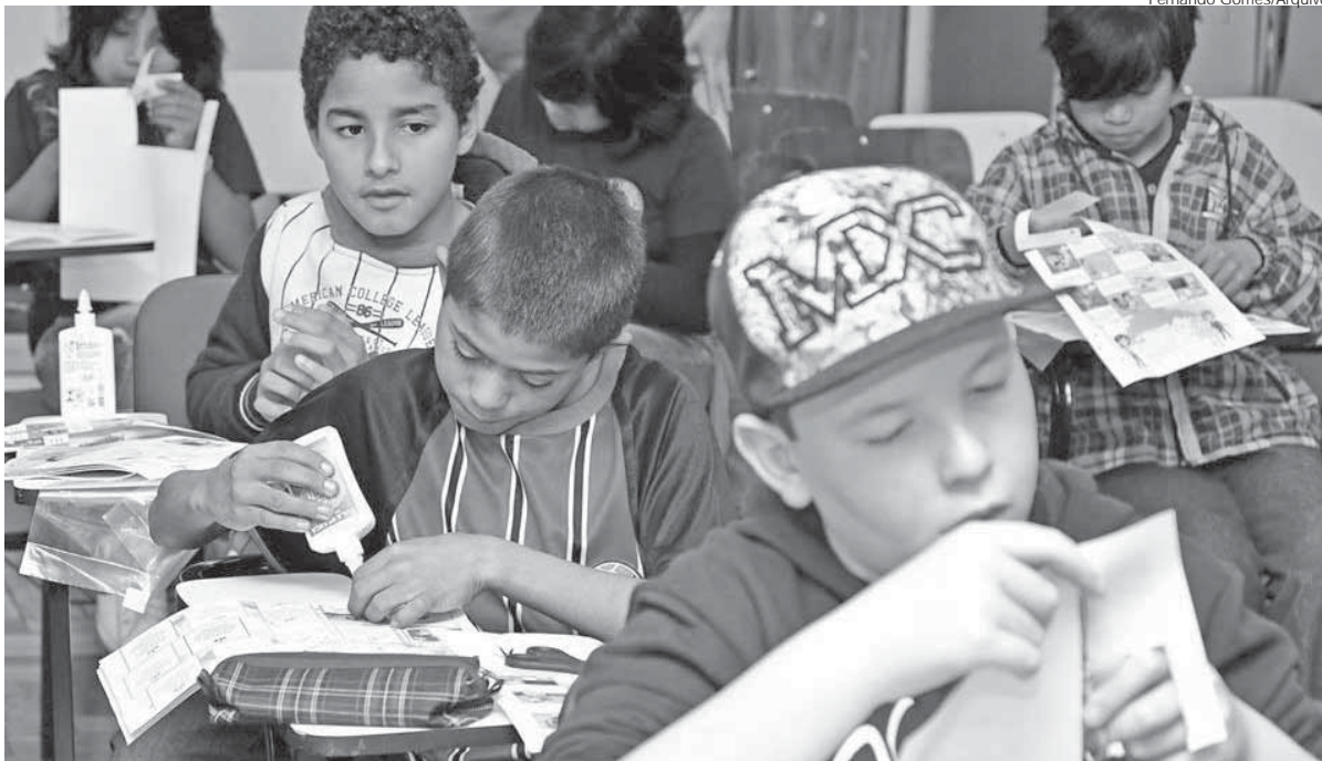
Planejamento da Secretaria de Educação é para que não falem vagas na Educação Infantil de Santo Ângelo

Conforme o cronograma da Secretaria Municipal de Educação, iniciou nesta segunda-feira, dia 3, o período para matrículas e rematrículas da rede pública municipal de ensino para o ano letivo de 2019.