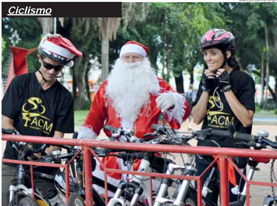
Entrega das bicicletas durante a terceira edição da ação