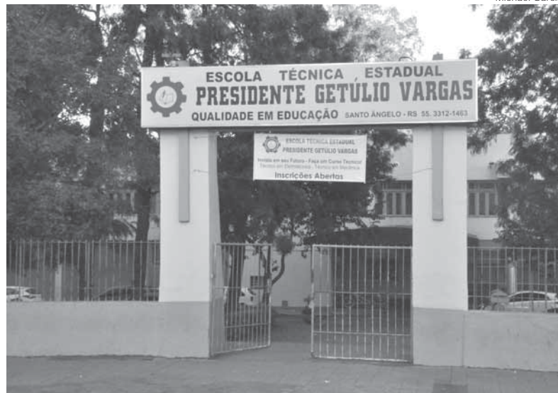
Escola Getúlio fica no Centro da cidade e é uma das mais tradicionais do município

No Câmpus de Santo Ângelo são ofertados os seguintes cursos, com respectivas vagas: Administração (100), Agronomia (45), Arquitetura e Urbanismo (50), Ciência da Computação (50), Ciências Biológicas – Bacharelado (30), Ciências Contábeis (60), Direito noturno (60), Direito diurno (60), Educação Física Licenciatura (30), Educação Física Bacharelado (30), Enfermagem (50), Engenharia Ci-