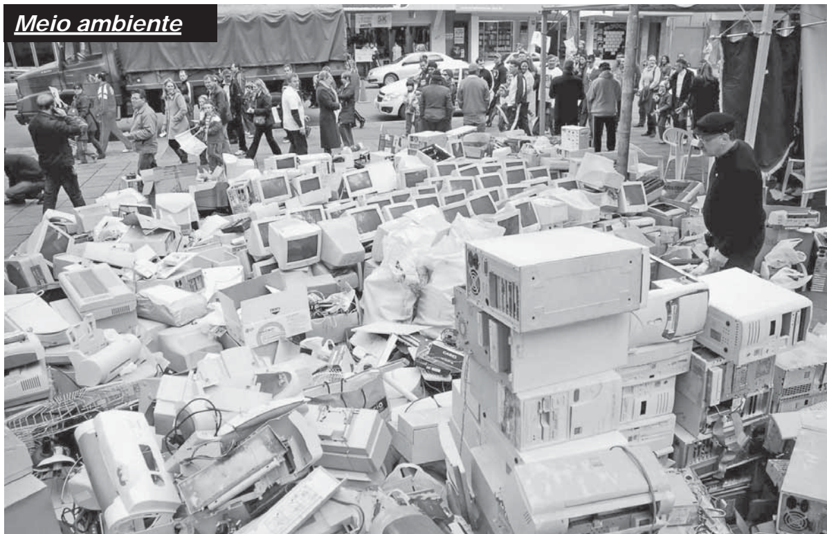
Materiais descartados durante uma das edições da campanha