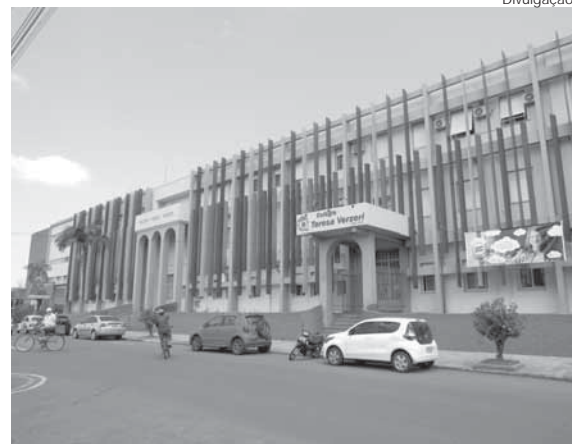
Nova fachada do Colégio Teresa Verzeri

A proposta educacional para 2019 do Colégio Teresa Verzeri foi divulgada durante um encontro de lançamento da Campanha de matrículas e rematrículas 2018 - 2019. A equipe diretiva está focada em ofertar uma pedagógica inovadora onde a sala de aula se transforma em um laboratório para "o aprender".