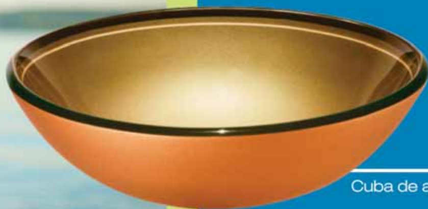
Cuba de apoio dourada