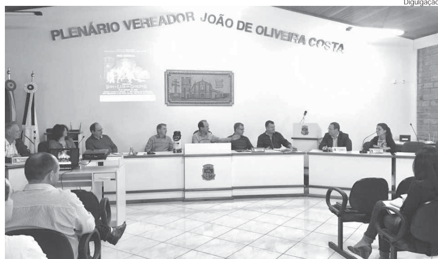
Câmara de Vereadores de São Miguel das Missões