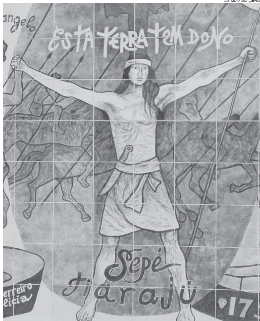
Imagem parcial do Mural de Danúbio Gonçalves - Obra Memorial da Epopeia Riograndense

A experiência em território latino-americano, entre 1609 e 1768,