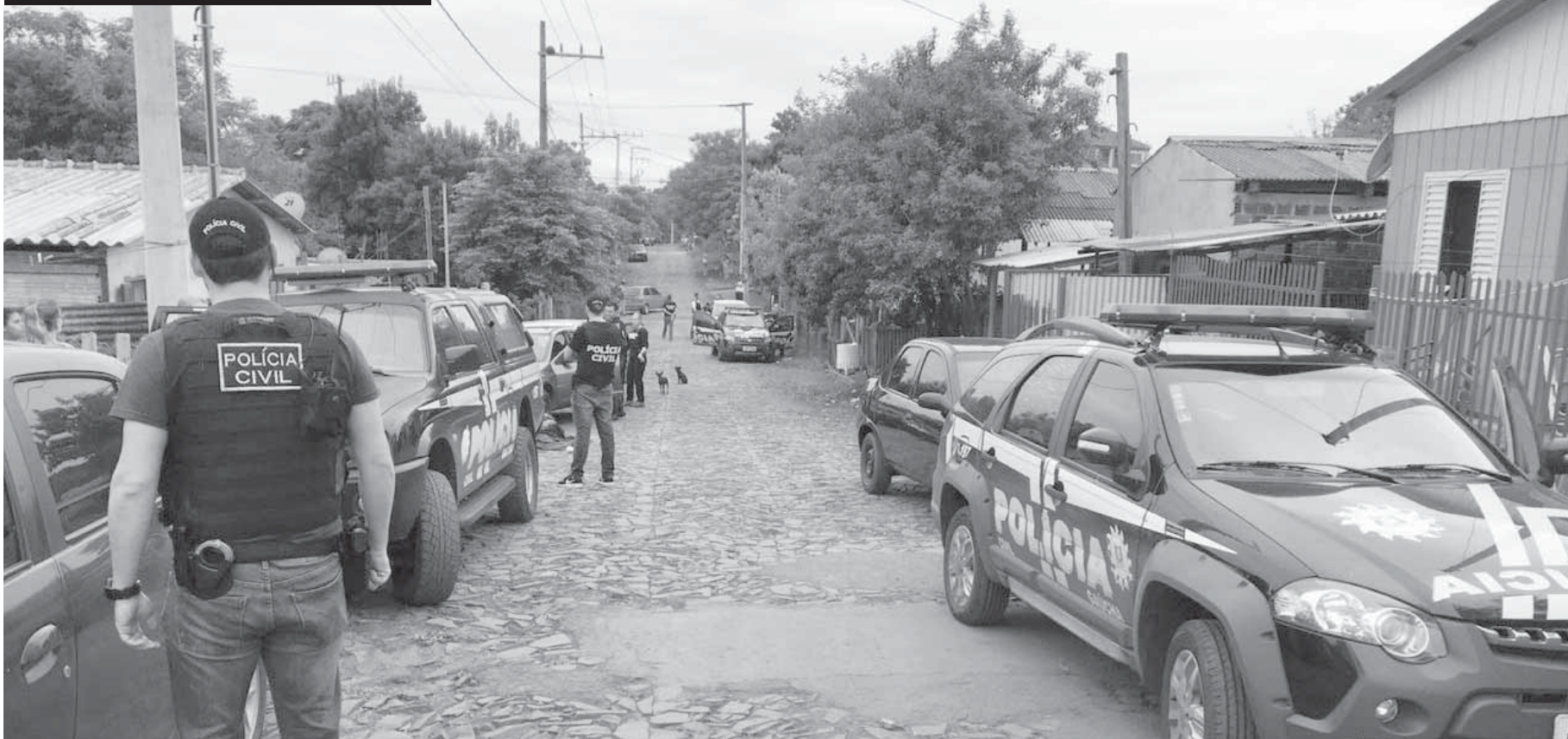
A operação aconteceu na manhã de ontem, no Bairro Santo Antônio e teve as participações de 24 policiais civis e oito viaturas