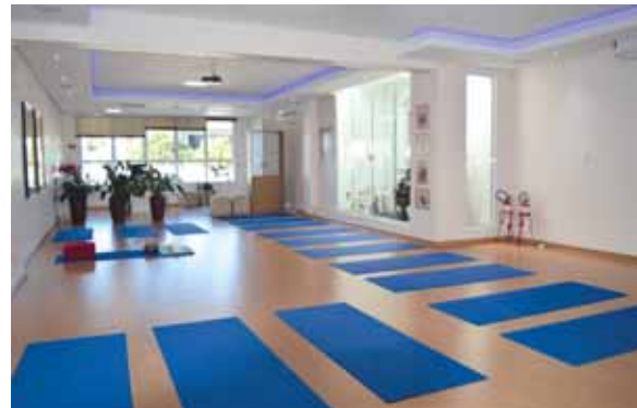
Novo espaço proporciona mais comodidade para a prática de yoga