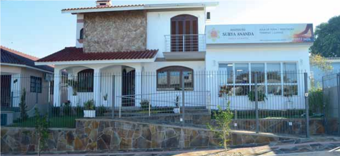
Instituto Surya Ananda está localizado na Travessa Fernando Ferrari, 148

O Instituto Surya Ananda ampliou suas instalações com o objetivo de melhorar o atendimento a comunidade santo-angelense e regional. A nova área, com mais de 80 metros quadrados, foi gestada com o objetivo de oferecer um ambiente com as condições ideais de conforto e bem estar, aos seus alunos de yoga, pacientes e cursistas.