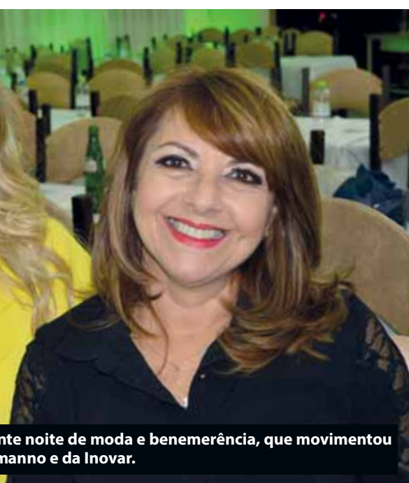
nte noite de moda e benemerência, que movimentou manno e da Inovare.