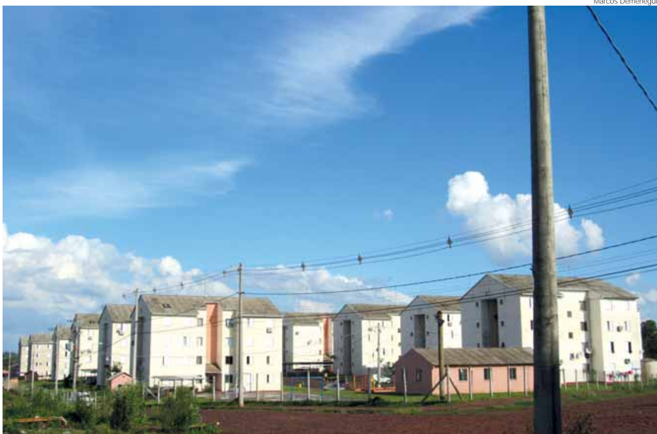
Empreendimento Romeu Goulart Loureiro, localizado no Bairro Faldino Siede na Zona Leste do município

O edital com as inscrições homologadas encontram-se no site do município (edital SMH/03/2018). A assistente social da SMH, Gersa Mumbach, informa que o sorteio será acompanhado pelo Conselho Municipal de Habitação.