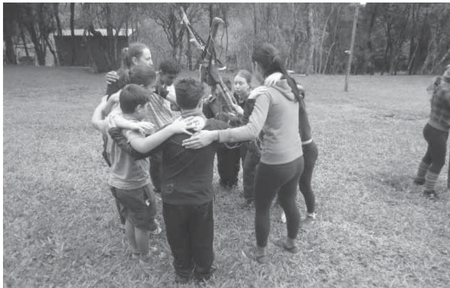
Escoteiros em atividades de Campo, Grito de Patrulha

Na última segunda-feira, dia 23, foi celebrado o Dia Mundial do Escoteiro. Em Santo Ângelo mais de 60 jovens participam das atividades do Grupo Medianeira, que busca incentivar o trabalho em equipe, disciplina e o desenvolvimento da comunidade