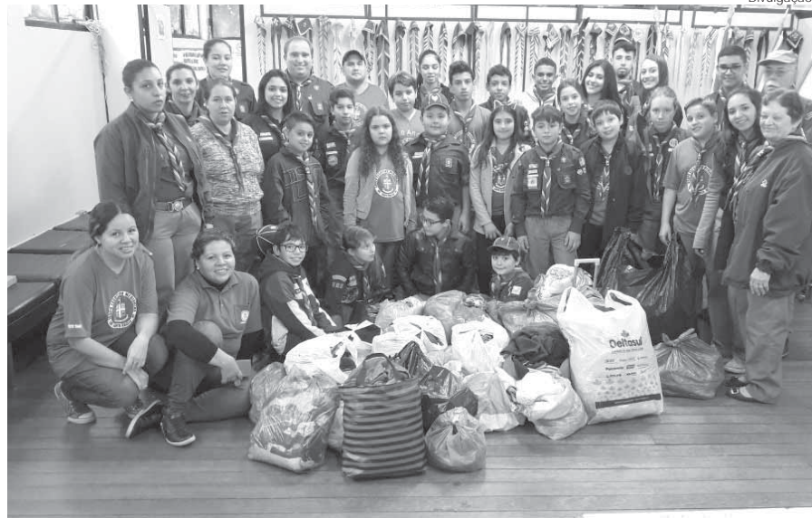
Escoteiros do Grupo Medianeira durante a Campanha do Agasalho do ano passado

O mundo todo celebrou na última segunda-feira, dia 23, o Dia do Escoteiro. O movimento está representado em Santo Ângelo por mais de 60 jovens do Grupo Medianeira, que buscam construir uma cidade melhor por meio de trabalho em equipe, atividades sociais e disciplina.