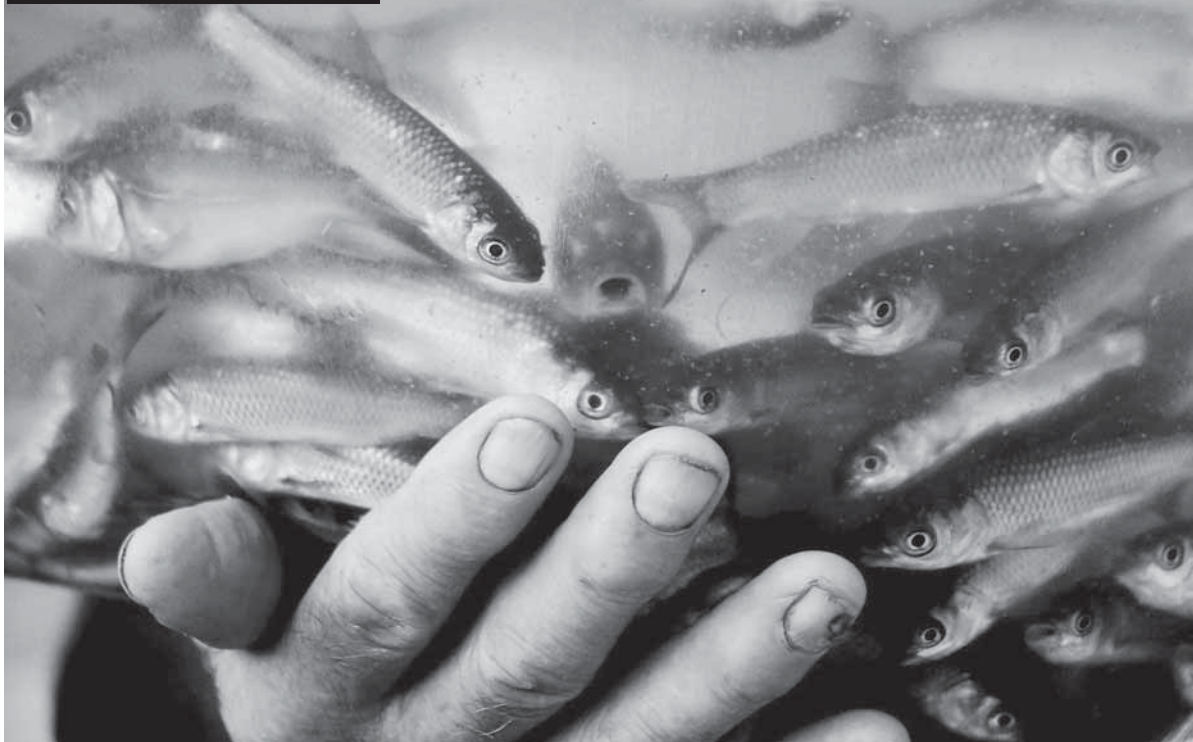
Agricultores receberam alevinos de espécies como carpa, jundiá, tilápia, piava, surubi e traíra