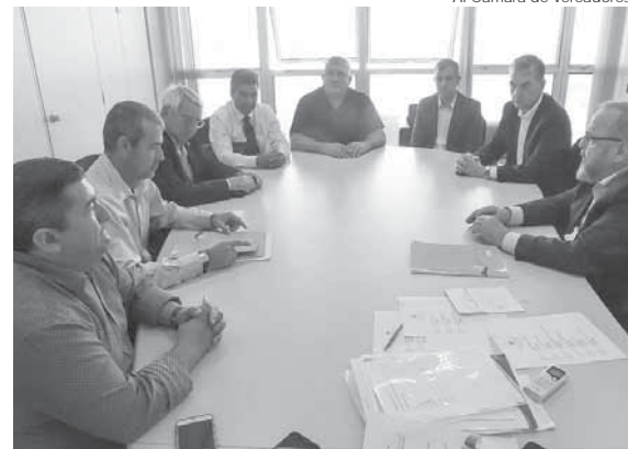
Audiência aconteceu na quarta-feira, dia 18, na Secretária Estadual de Saúde

O atraso no repasse de valores que viriam do Governo do Estado para o Hospital Santo Ângelo foi um dos temas da audiência ocorrida na quarta-feira, dia 18, na Secretaria Estadual de Saúde.