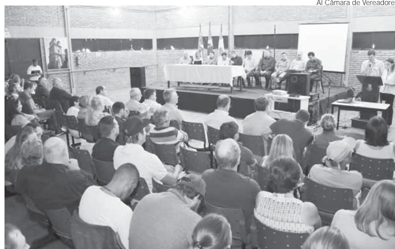
Lançamento aconteceu no Centro Municipal de Cultura, na manhã de ontem

Além disso, nos dias 15 e 16 de maio será realizado o Acampamento da Cidadania, no trevo de entroncamento da BR 285 com a ERS 344, no acesso a Entre-Ijuís. No dia 17 de maio está prevista a marcha, com saída às 8h30min no Trevo do Posto Carreteiro.