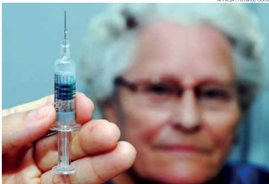
Idosos estão entre os grupos prioritários para receber uma dose da vacina

Fazem parte das categorias de riscos portadores de doença respiratória crônica, doença cardíaca, doença renal, doença hepática, do-