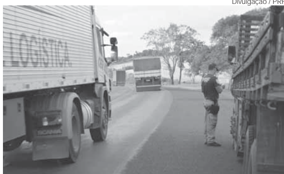
Além das fiscalizações, a Polícia Rodoviária Federal também realizou ações de conscientização

Em revista pessoal, foi localizado com um deles duas buchas de cocaína pesando aproximadamente 1,0 gramas, no bolso da calça e com outro uma bucha de cocaína também no bolso da calça pesando aproximadamente 0,5gramas. As referidas substâncias foram apreendidas e foi confeccionados termos circunstanciados aos acusados.