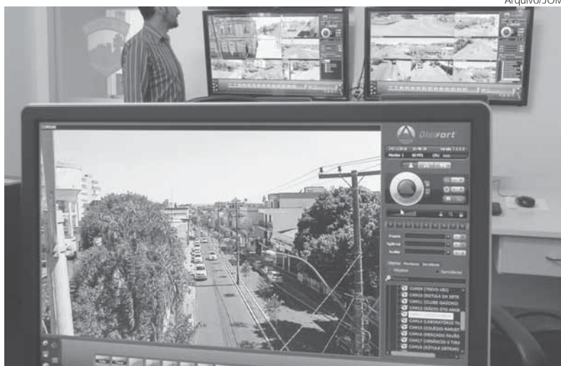
O sistema funciona 24 horas e tem longo alcance. O Centro de Operações funciona junto ao Quartel do 7º RPMon.

Um dos acidentes com danos materiais ocorreu na manhã do dia 29 (quinta-feira), na BR 158 em Cruz Alta, quando um Renault/Scenic teve um problema mecânica e acabou saindo de pista à esquer-