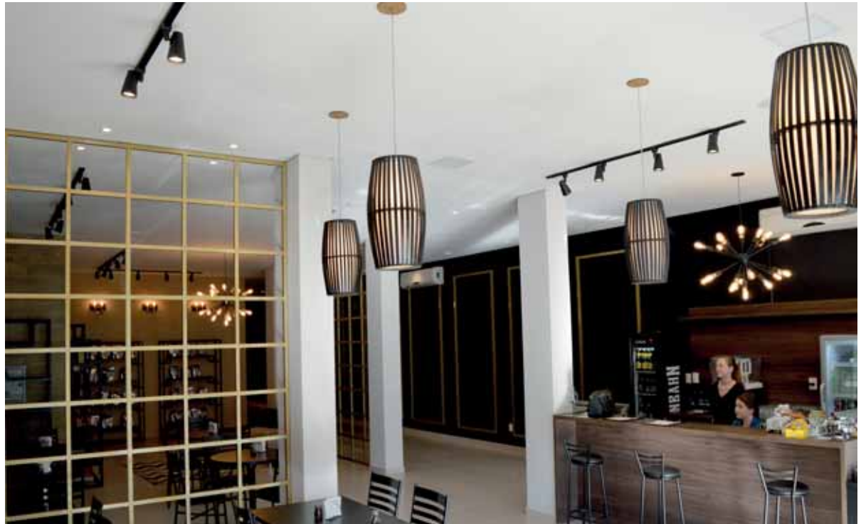
O Café oferece um ambiente conceitual, inspirado nos tradicionais bistrôs e cafés de Paris

As empreendedoras fizeram uma avaliação positiva já nos primeiros dias de atendimento, destacam que a receptividade superou as expectativas. Contudo, fazem um convite para que toda a comunidade vá até o Santé Café “conhecer o local e provar os de-