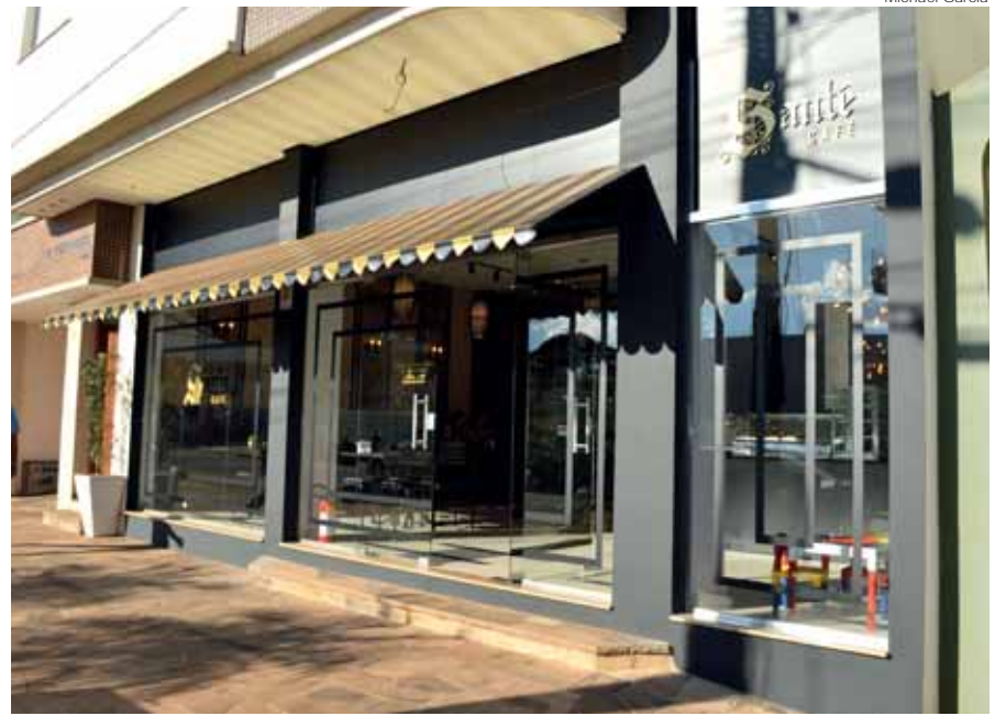
Santé está localizado na Rua Quinze de Novembro, 1349, no Centro