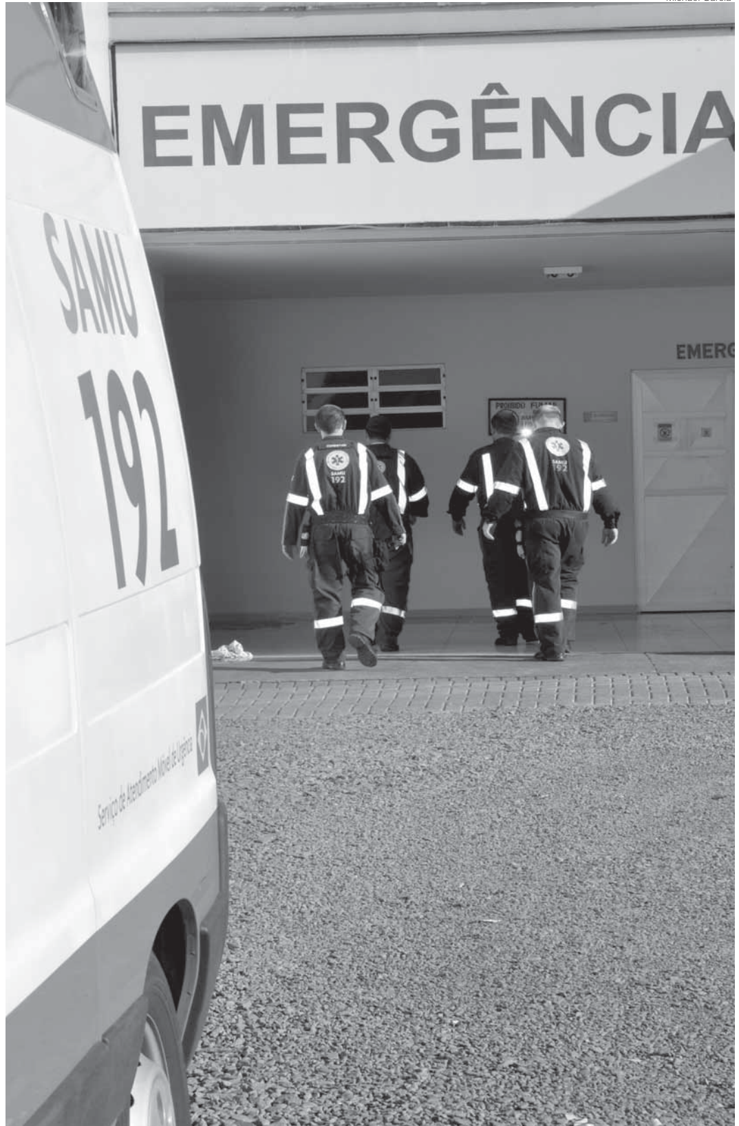
Samu tem como base o Hospital Santo Ângelo e atende também as cidades de Entre-Ijuís, Eugênio de Castro, Vitória das Missões e Sete de Setembro

O Samu promove também um trabalho de educação continuada e voluntária junto a escolas, entidades, instituições e empresas de Santo Ângelo e região. Nestas atividades são repassadas orientações de como acionar o serviço, a forma correta do atendimento básico de primeiros socorros até a chegada da equipe do Samu. "O socorro adequado faz toda a diferença na resoluibilidade da sobrevida do paciente até o atendimento do Samu", observa o enfermeiro Alex.