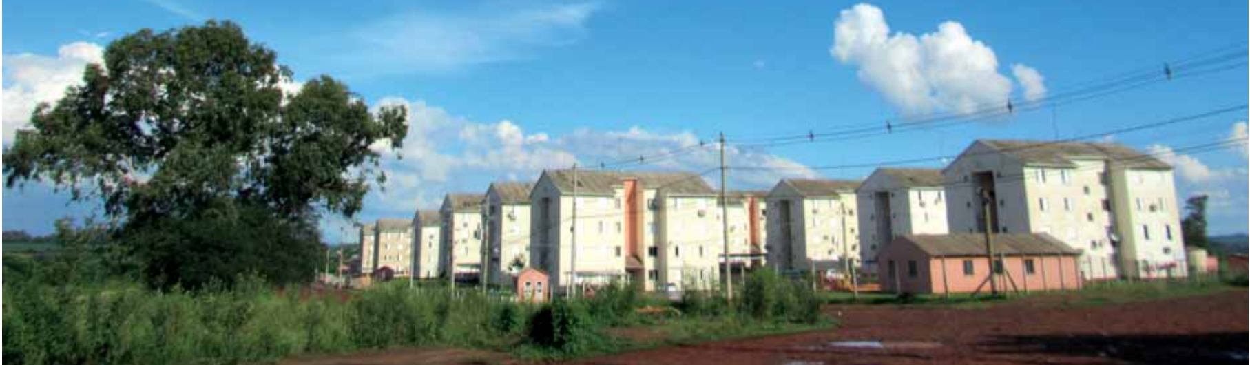
Conjunto habitacional no Bairro Pillau

A seleção dos novos mutuários será realizada mediante condições de enquadramento e critérios de prioridade, confira do box acima