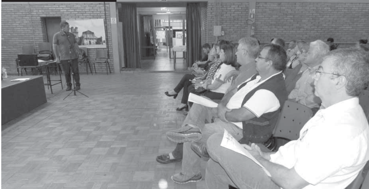
O encontro ocorreu no auditório do Centro Municipal de Cultura