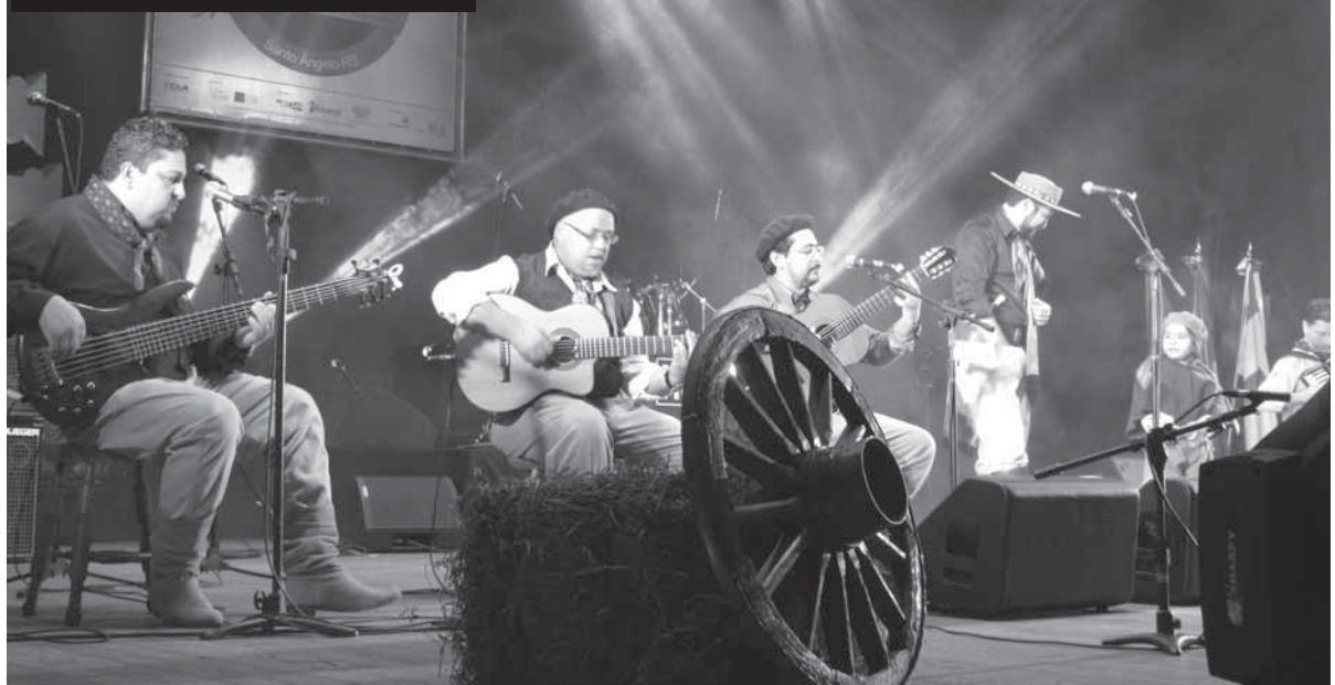
Apresentações artísticas durante a última edição do evento