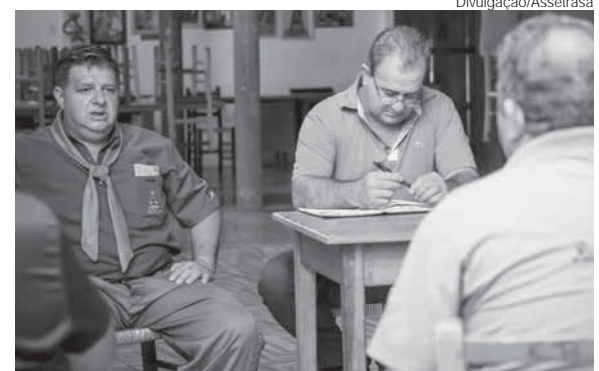
Durante a reunião, foi tratado dos preparativos para os eventos tradicionalistas que serão realizados neste ano

Além do Rodeio da Assetrasa, está prevista, novamente, a realização em Santo Ângelo de uma das etapas da Inter-regional do Enart (Encontro de Artes