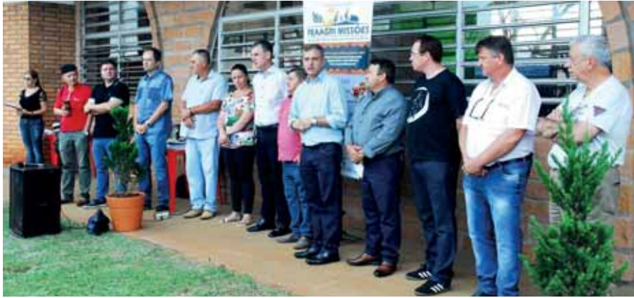
Lançamento aconteceu durante o Café Colonial, no Pavilhão de Hortifrutigranjeiros

Foi lançado oficialmente no último sábado, dia 17, a 9ª FEAAGRI Missões - Feira da Agroindústria e agricultura Familiar. O lançamento aconteceu durante o Café Colonial Missioneiro, no Pavilhão de Hortifrutigranjeiros, localizado na Avenida Venâncio Aires e contou com a presença de autoridades locais e convidados.