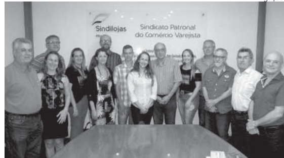
Atual diretoria do Sindilojas Missões

Nesta quarta-feira, acontece a eleição para nova diretoria do Sindilojas Missões, que terá a missão de coordenar os rumos da entidade pelos próximos quatro anos.