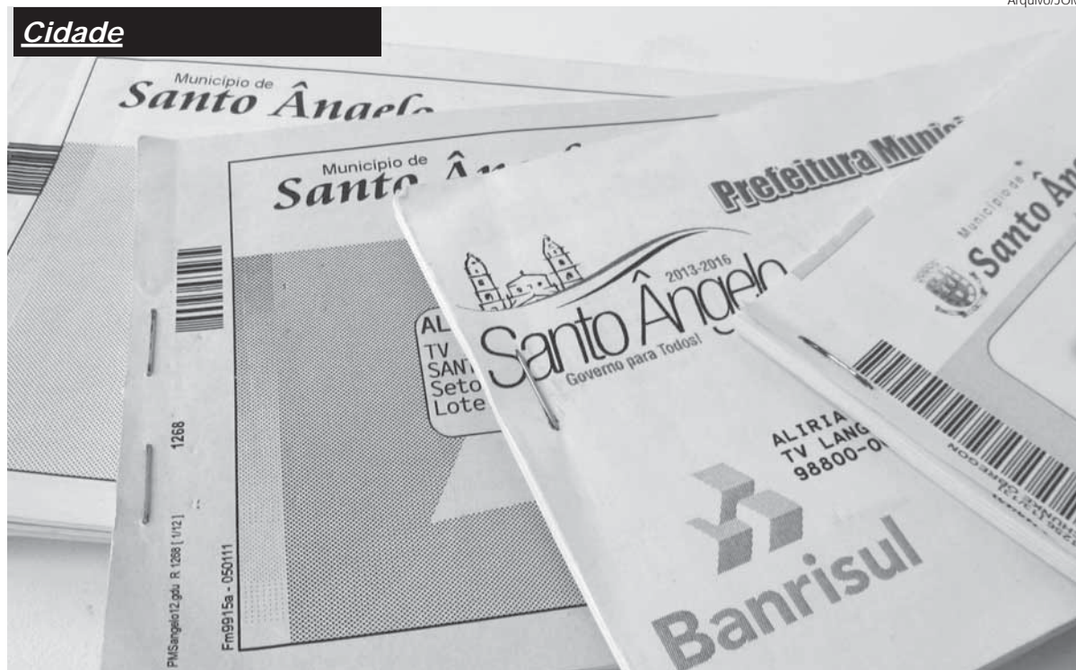
Carnês do Imposto Predial e Territorial Urbano (IPTU)