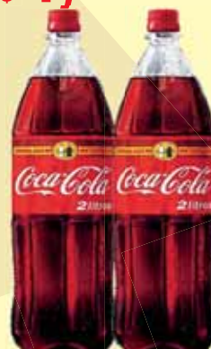
COCA-COLA 2L RETORNÁVEL S/C