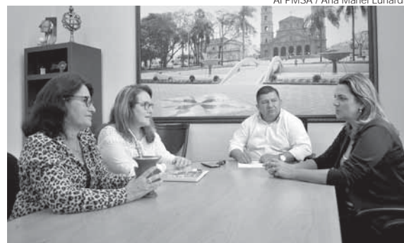
Reunião tratou sobre as atividades que permitirão uma maior convivência entre crianças e idosos

Firmar parcerias a fim de promover ações contínuas de valorização, atenção e respeito aos idosos. Esse foi o principal objetivo da reunião realizada na quinta-feira, dia 24, entre a Câmara de Vereadores, Secretaria de Assistência Social e Conselho Municipal do Idoso – COMID.