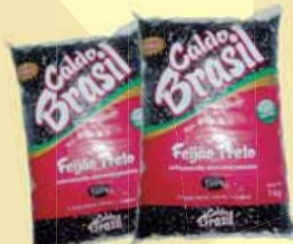
FEIJÃO PRETO CALDO BRASIL KG