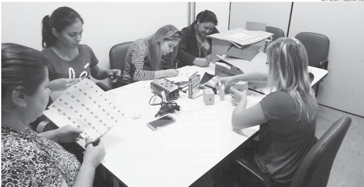
Professores e auxiliares de educação confeccionam os brinquedos

A Secretaria Municipal de Educação (SME) iniciou 2018 com um novo projeto que conta com a participação de 15 professores e auxiliares de educação que estão confeccionando jogos pedagógicos a partir de sucatas para os alunos das séries iniciais e ensino fundamental. Esses jogos serão repassados para as escolas da rede pública do município e são voltados especificamente para auxiliar na alfabetização e no aprendizado da matemática,