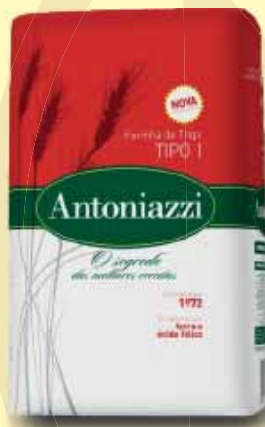
FARINHA DE TRIGO ANTONIAZZI 5KG