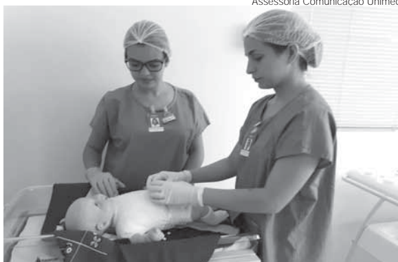
Curso é realizado no centro cirúrgico e berçário do Hospital Regional da Unimed Missões

Conforme Paola, com as atividades propostas os participantes sentem-se mais preparados para o dia do parto. “Nós buscamos esclarecer todas as dúvidas dos