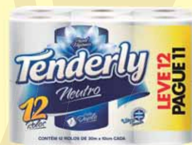
PAPEL HIGIÊNICO TENDERLY LV12 PG 11