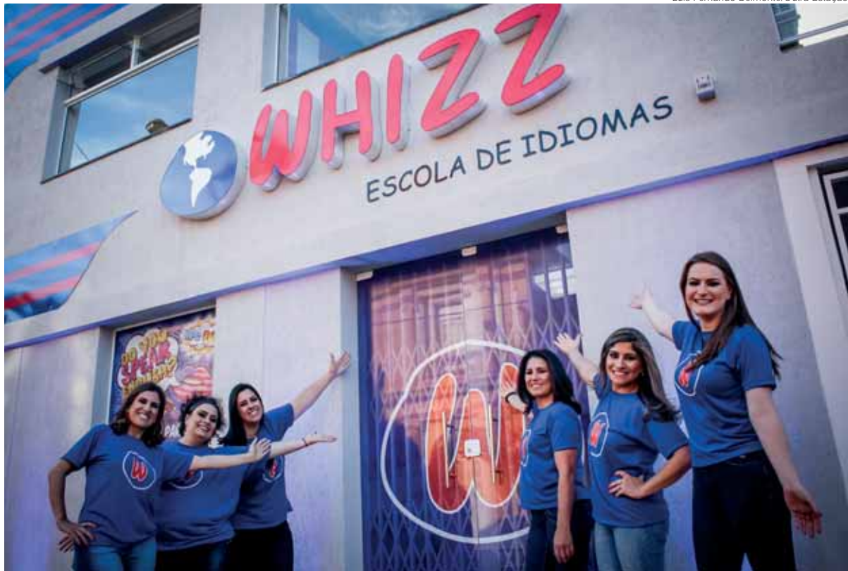
Nova sede da Whizz fica na Rua Antunes Ribas, em frente à Prefeitura Municipal