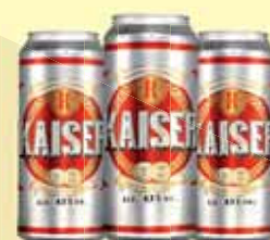
CERVEJA KAISER 473ML