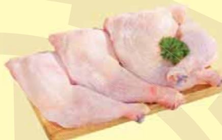
COXA E SOBRECOXA KG