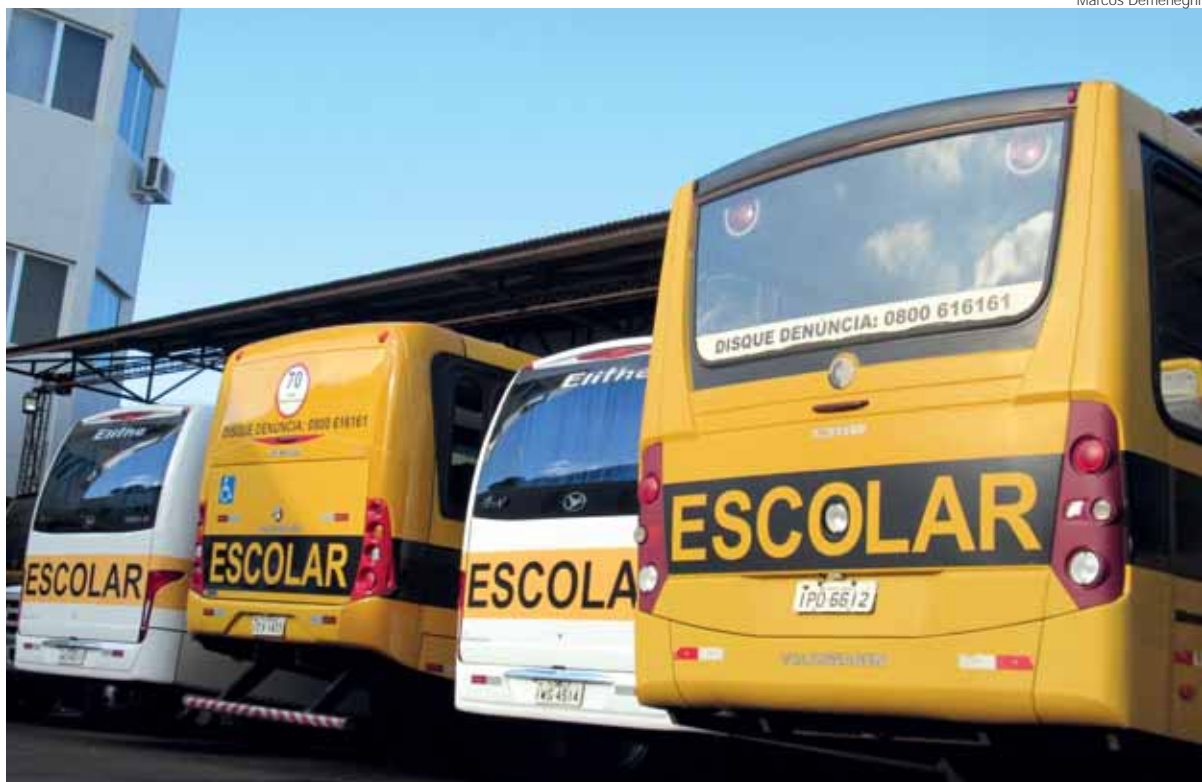
Veículos utilizados no transporte escolar municipal

Em 2017 o transporte escolar municipal, que é de responsabilidade da prefeitura, atendeu 1.300 alunos, que residem na zona urbana e rural e estudam em escolas do município. Atualmente o serviço conta com 22 linhas de ônibus, destas 13 são feitas por ônibus da prefeitura de Santo Ângelo e nove veículos são de propriedade de empresa terceirizada. Além disso, o serviço atende alunos de 40 escolas da rede municipal de ensino.