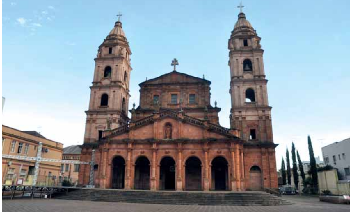
Catedral Angelopolitana fica no Centro Histórico e é o principal cartão postal de Santo Ângelo