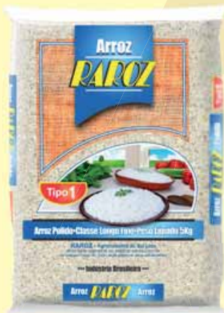
ARROZ RAROZ T1 5KG