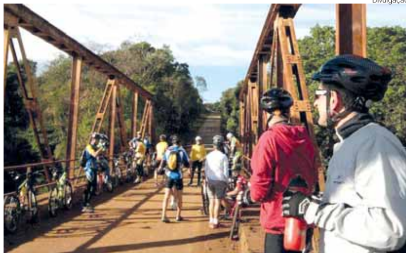
Ponte de Ferro, no Interior de Entre-Ijuís faz parte do roteiro do 7º Pedalando Missões

A concentração do desafio será em Frente a Catedral Angelopolitana entre as 6h e 7h. Antes