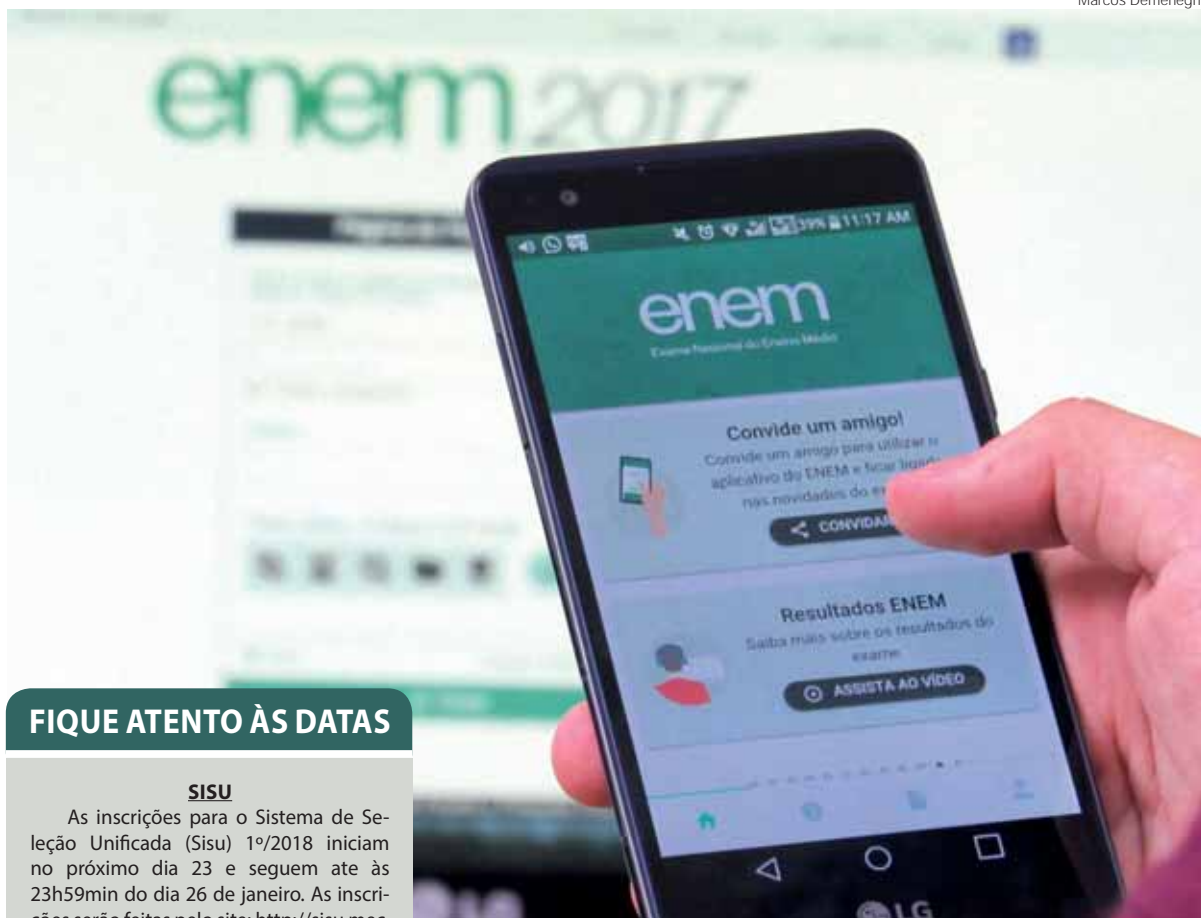
Resultados também podem ser conferidos pelo aplicativo oficial do ENEM