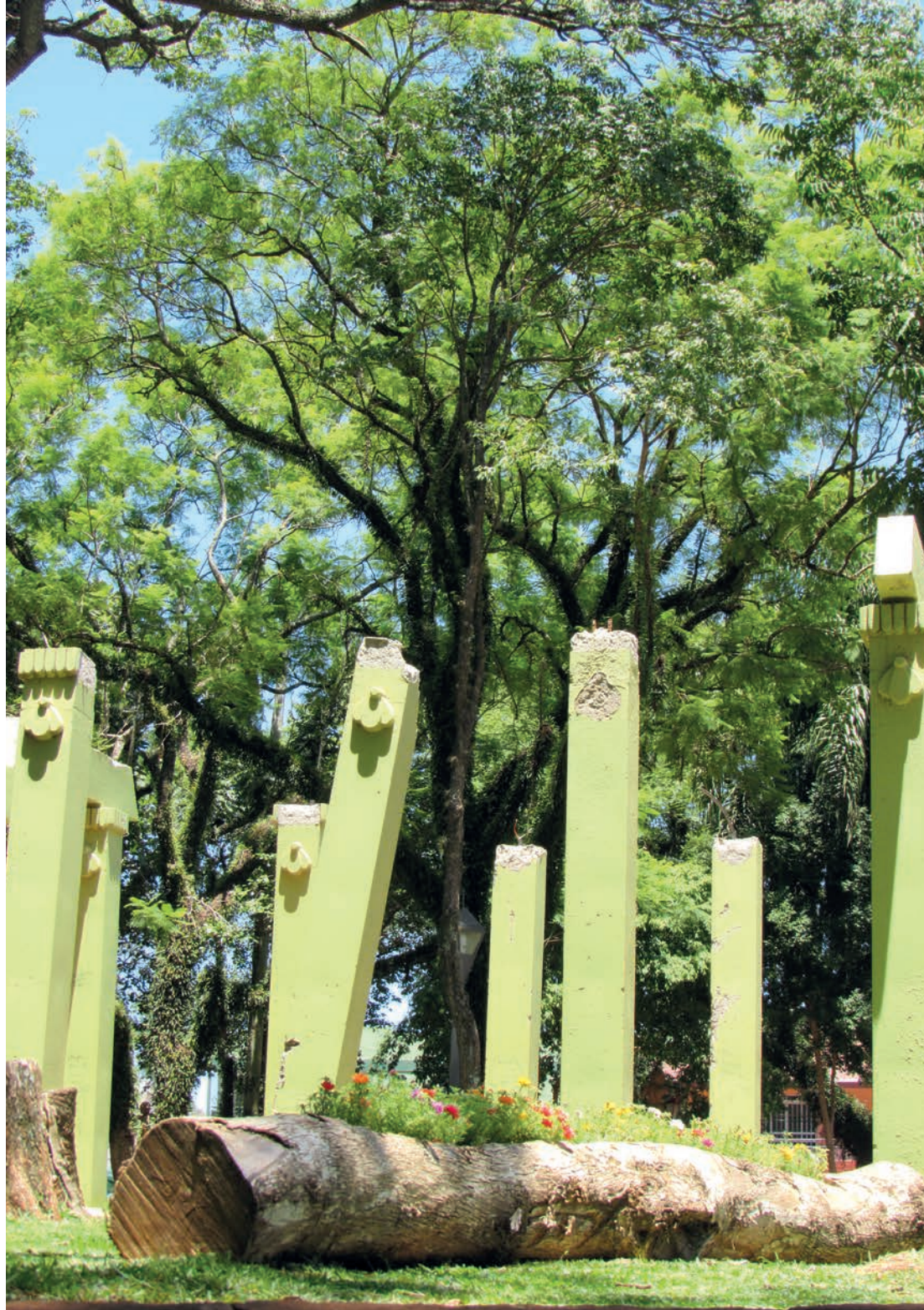
Tronco de um Jacarandá Mimoso é transformado em Floreira na Praça Pinheiro Machado em Santo Ângelo