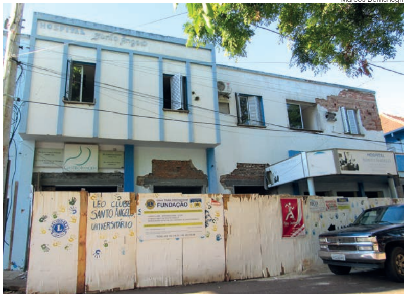
Estado atual da fachada do Hospital Santo Ângelo

foi realizada a visita técnica in loco na obra.