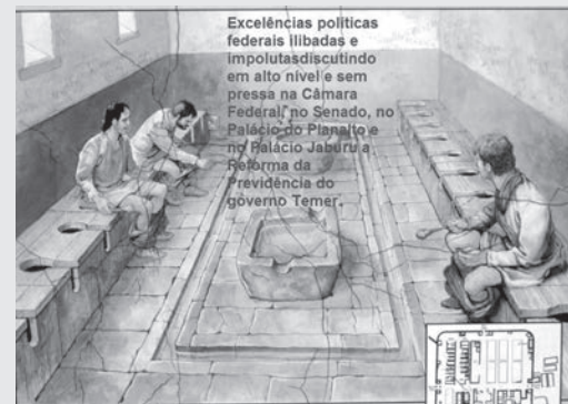
Excelências políticas federais ilibadas e impolutas discutindo em alto nível e sem pressa na Câmara Federal, no Senado, no Palácio do Planalto e no Palácio Jaburu a Reforma da Previdência do governo Temer.

E outra coisa é esta: povo e país cansaram de carregar nas costas políticos corruptos, reformistas e privatistas – deputados estaduais, deputados federais, senadores, ministros, presidentes, governadores... Estão mais que cansados de terem esses tipos de políticos, esses tipos de governantes! Estão mais que cansados de políticos e de governantes corruptos, falsos, imunes e impunes, hipócritas e execráveis, que não valem nem o flato que soltam nos gabinetes e nas latrinas! Estão mais que cansados de serem sempre escravos e saqueados! Anelam que os políticos corruptos, capachos de oligarcas nacionais e internacionais inescrupulosos e aventos, caiam fora de vez e desapareçam para sempre, a votos ou a outros jeitos!