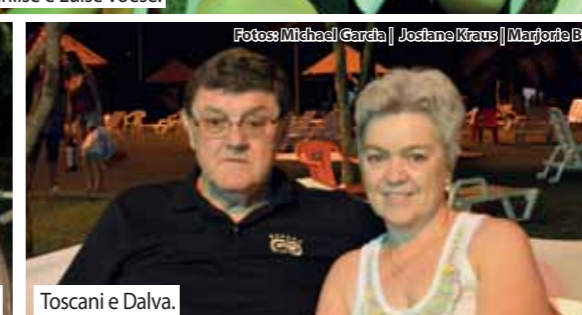
Toscani e Dalva.