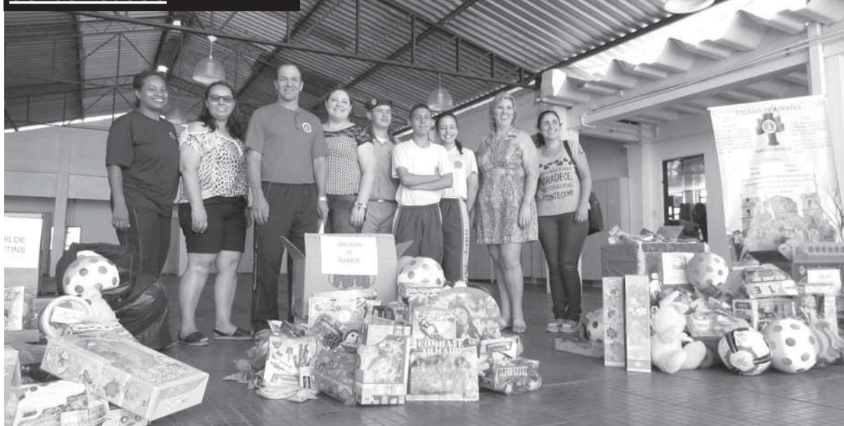
Uma rápida solenidade de entrega foi realizada na manhã de ontem