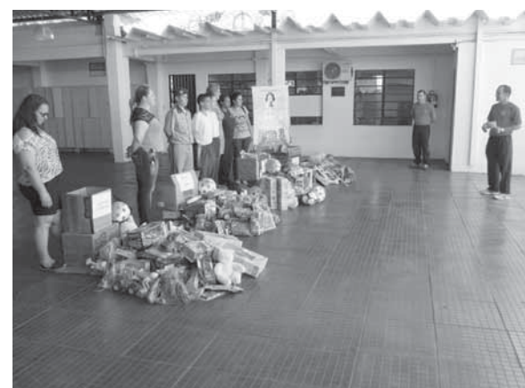
Capitão Sirlando da Ponte fala para as diretoras