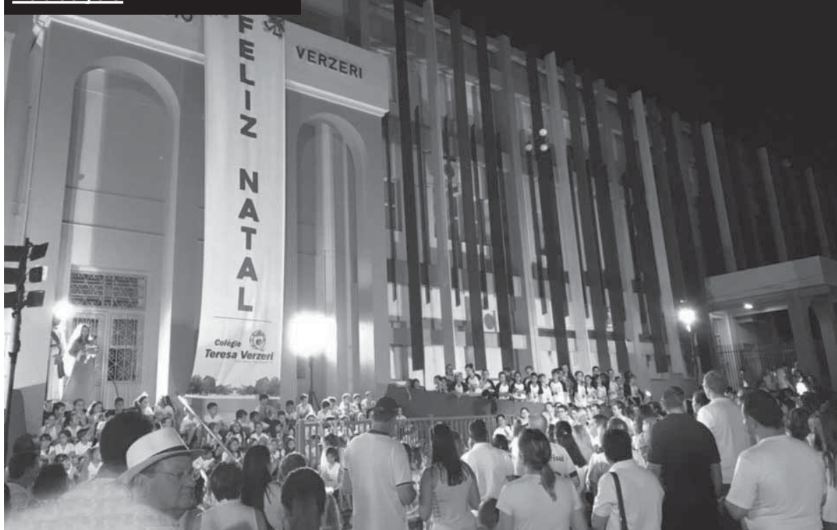
Caminhada da Luz teve apresentações em frente ao Colégio Teresa Verzeri