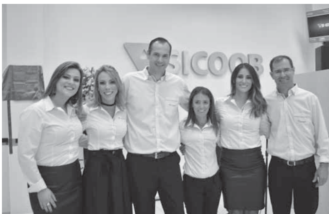
Equipe de colaboradores da agência Sicoob de Santo Ângelo