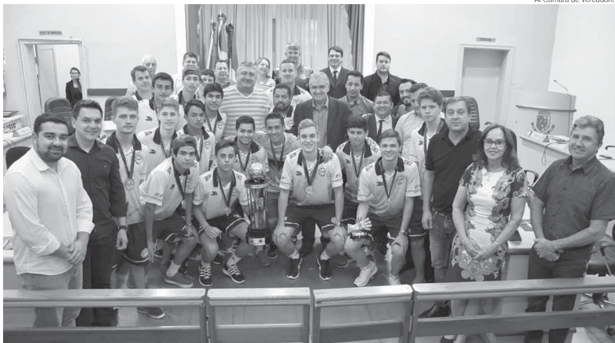
Jogadores e diretores da Asaf receberam a homenagem dos vereadores na última segunda-feira, dia 11

O empenho, assim como as conquistas obtidas recentemente pela Associação Santo Ângelo de Futsal (Asaf), tiveram destaque durante sessão especial na Câmara de Vereadores.