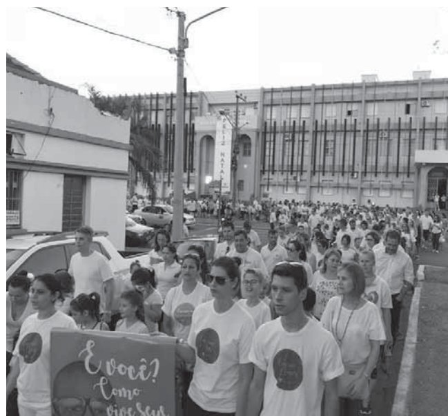
Caminhada iniciou em frente ao Verzeri e seguiu por ruas centrais

Segundo os organizadores, a Família Verzeriana busca por meio da ação, chamar a atenção para o Natal, que é uma das épocas mais importante da história humana, em que Jesus – o Filho de Deus – se tornou presente em nossa vida e nos mostrou o caminho da verdadeira humanização. Além disso, desejaram um feliz Natal para toda a comunidade santoangelense, em nome de toda a da Direção, Irmãs Filhas do Sagrado Coração de Jesus e colaboradores do Colégio Teresa Verzeri.