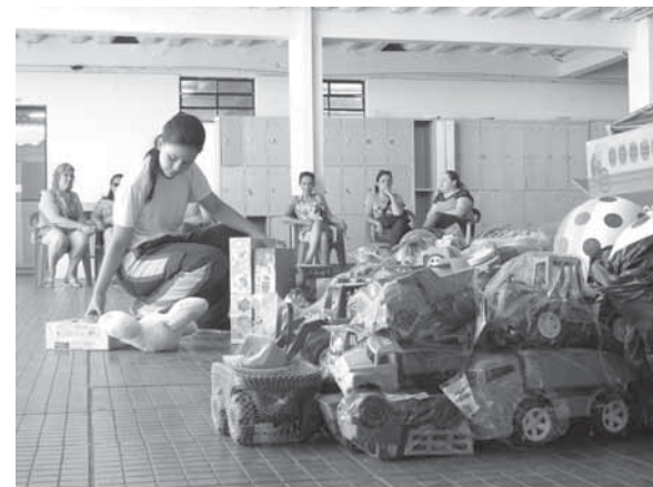
As doações foram da comunidade e dos alunos