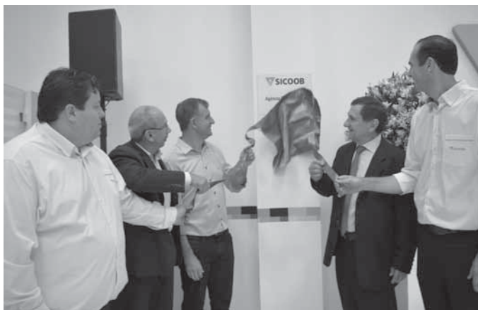
Momento do descerramento da placa de inauguração

A solenidade foi realizada na noite da última sexta-feira, dia 8. Com mais de 3, 7 milhões de associados, o Sicoob é o maior sistema financeiro cooperativo do país