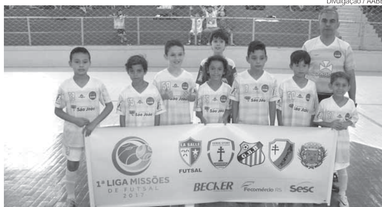
Time Sub-8 é uma das equipes que conseguiu a classificação para a final

A competição conta com a participação de cinco escolinhas da Região: AABB Santo Ângelo/Verde Sport, La Salle de Cerro Largo, Escolinha Municipal de Cerro Largo, GBB De São Luiz Gonzaga e AFSN de São Nicolau.