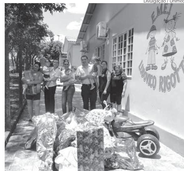
Integrantes da Unimed efetuaram a entrega dos presentes

Na última sexta-feira, dia 8, os integrantes do time efetuaram a entrega dos presentes diretamente à equipe diretiva da Escola Municipal de Educação Infantil Ludovico Rigotti, localizada no bairro Piratini de Santo Ângelo. As crianças receberão os presentes em celebração de Natal, que será realizada nesta quarta-feira, dia 13, com a presença do Papai-Noel na Escola e atividades alusivas à data.