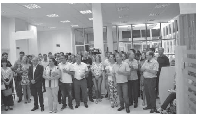
Convidados, autoridades locais e empresários participaram da cerimônia de inauguração da agência Sicoob de Santo Ângelo

A Sicoob inaugurou na noite da última sexta-feira, dia 8, a primeira agência em Santo Ângelo. A solenidade reuniu convidados, autoridades, empresários e imprensa. A agência Sicoob de Santo Ângelo fica Rua Andradas, 960, na esquina com a Marquês do Herval e já está aberta para toda a comunidade missioneira.