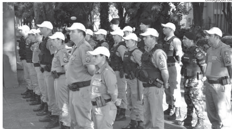
Solenidade de lançamento reuniu Policiais Militares na última terça-feira, dia 5 na Praça Leonidas Ribas

Segundo a BM, anualmente, no mês de dezembro, há uma intensificação de vendas junto ao comércio para fazer frente às festas de Natal e passagem de ano. Neste período, há um incremento junto aos estabelecimentos comerciais, com ampla movimentação de compras, contribuindo para o aumento nos indicadores criminais devendo, portanto, se estabelecer uma intensificação da ação presença real e potencial