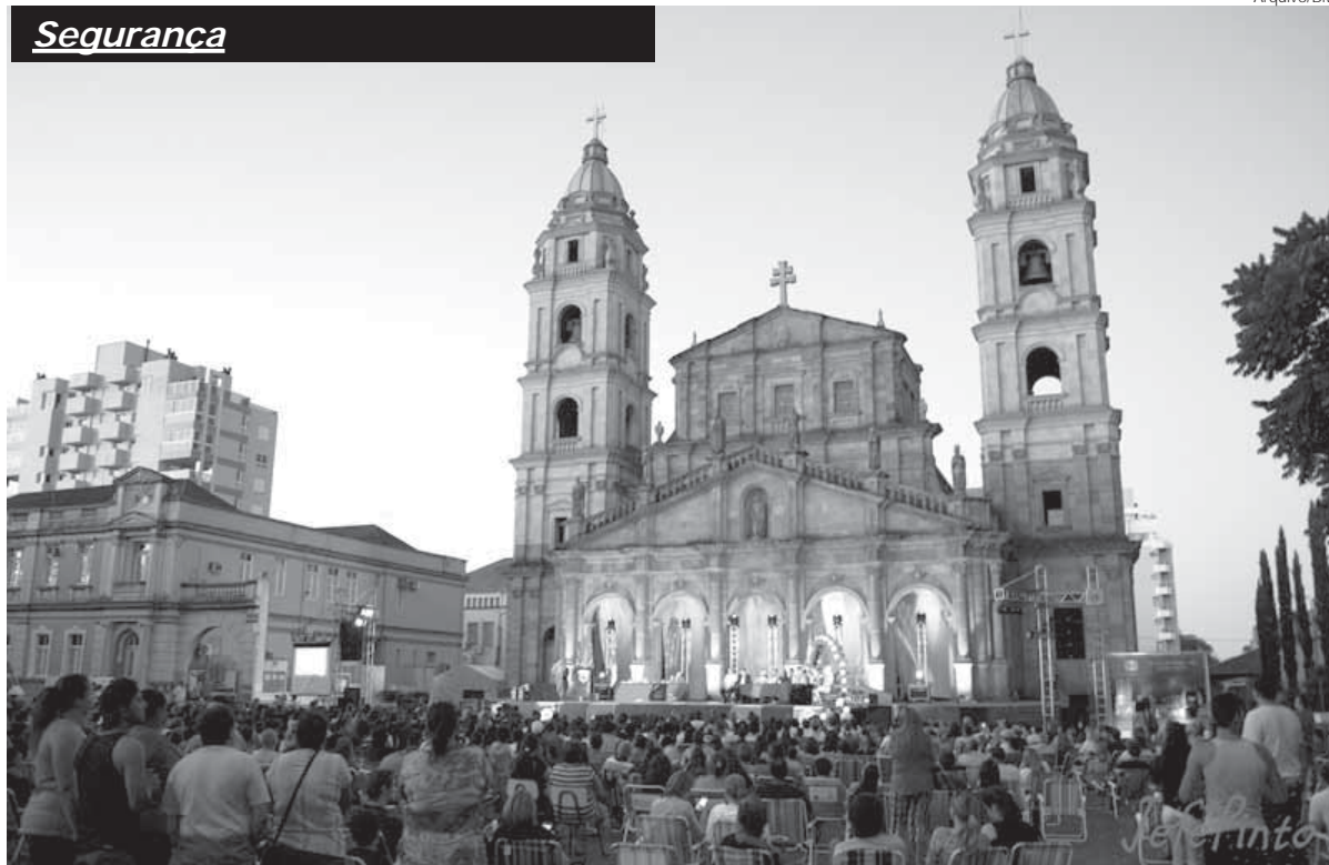
Solenidade de formatura tradicionalmente reúne alunos e familiares no Centro Histórico Municipal