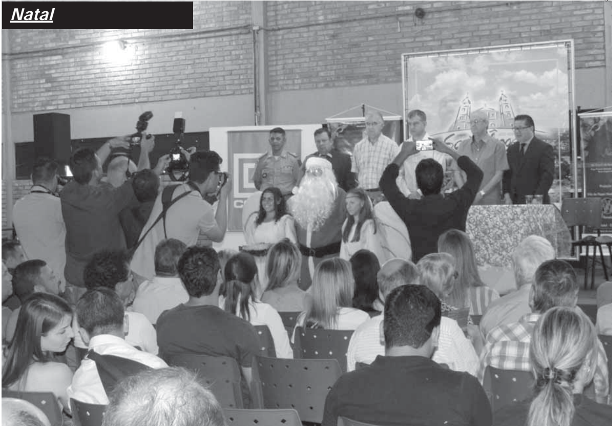
Imprensa acompanhou a solenidade no auditório do Centro Municipal de Cultura